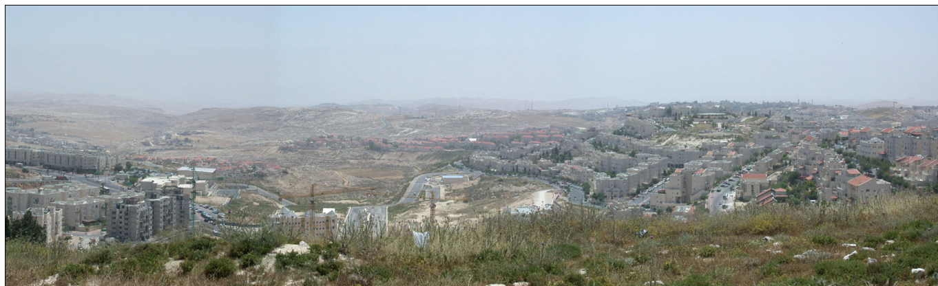
מבט לכיוון מזרח מפסגת התל.