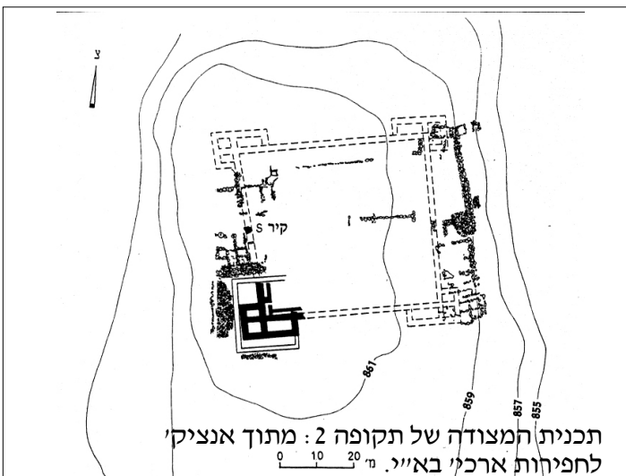
תכנית המצודה של תקופה 2: מתוך אנציק' לחפירות ארכ' בא"י. מ" 0 10 20

שחר פוני - אדריכל גדעון סולימני - ארכיאולוג