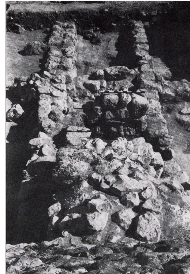
קטע מחומת הסוגרים המערבית, בסיום החפירה. מתוך: האנציקלופדיה החדשה לחפירות ארכיאולוגיות.