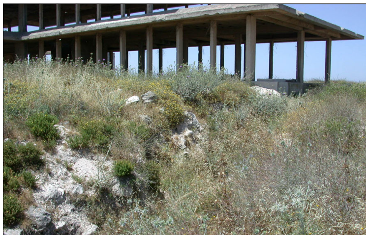
שלד ארמון מלך ירדן, בסמוך לבורות החפירה.