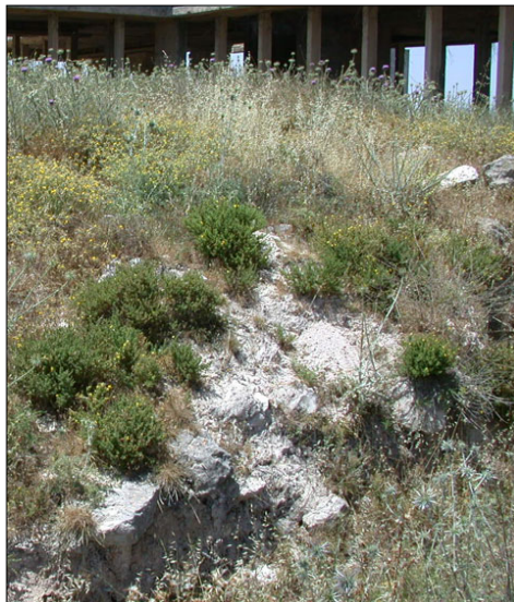
מראה בור חפירה, יוני 2002