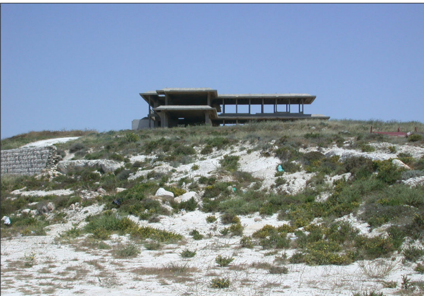
תל אל פול: מראה הפיסגה

שרידי עיר ומצודה מהתקופות: ברזל אי-ב', בבליה, חשמונאית והרודיאנית. רוב החוקרים מזהים באתר את מקומה של גבעה (גבעת בנימין, גבעת שאול) שהיתה העיר הראשית בנחלת בנימין בימי השופטים ועיר המלוכה של שאול. הישוב הקדום ביותר בתל היה כנראה בתקופת הברונזה התיכונה. הישוב הראשון בתקופת הברזל נוסד במאה ה-י"ב לפסה"נ. מתקופה זו נתגלו רק שרידי בניה מועטים. מהתקופה השנייה נחשפה מצודה הבנויה אבנים גדולות. עפ"י השחזור שהציע אלברייט, היתה למצודה תכנית מלבנית, חומת סוגרים בהיקפה ומגדלים תומכים שעמדו בכל אחת מפילותיה. חוקרים רבים מטילים ספק בקיומה של חומת סוגרים. מהתקופה השלישית נחשפו שרידיה של מצודה חדשה, מהמאה השביעית לפסה"נ. מהתקופות ההלניסטית והרומית נחשפו שרידים דלים. בכל שטח התל נחשפו אסמים חצובים בסלע. תל אל פול הוא התל השני בחשיבותו בירושלים, אחרי עיר דוד.