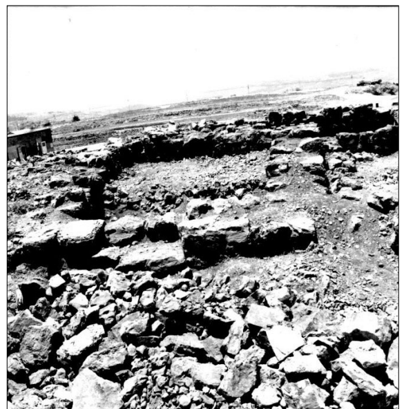
מראה (בעונת החפירה). מתוך : תיק י-ס/מ/2/1/2