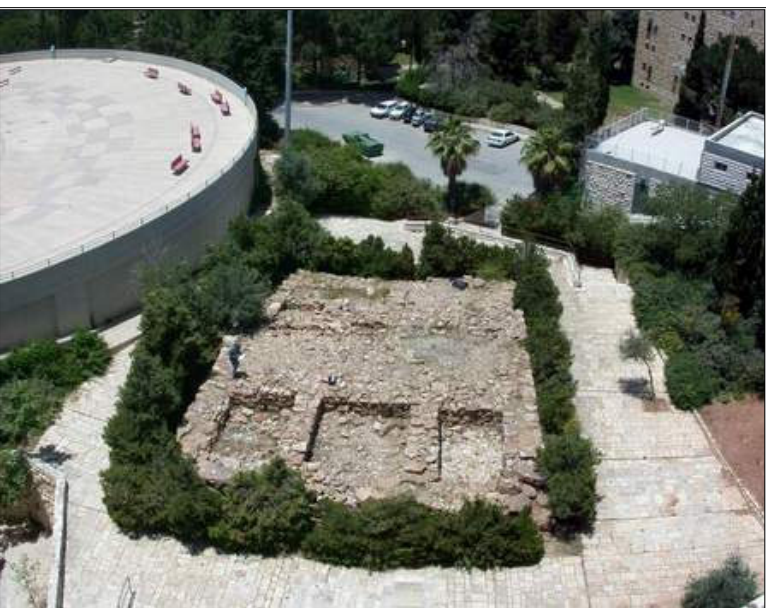
גבעת שפירא (מצד): מראה כללי

תאור הממצאים: יסודות של מבנה, שנבנו באבני צור. תכנית המבנה מלבנית (17*21 מ'), במרכז המבנה חצר ומשני צדיה מספר חדרים. עובי הקירות החיצוניים: 1.80 מ'. יש להניח כי המבנה אינו אלא מסד של מצד אשר נבנה מעליו. בין אבני המילוי נמצאו שברים של כלי חרס השייכים כנראה לסוף תקופת הברזל או לראשית התקופה הפרסית. הובחנו שתי תקופות שימוש: בתקופת הברזל/פרסית וכן בתקופה ההרודיאנית. מאוחר יותר הותקנו בו מבנים חקלאיים אשר שינו את תכניתו המקורית. ממערב למבנה נחצבה גת גדולה ובמרכזה בור מים.