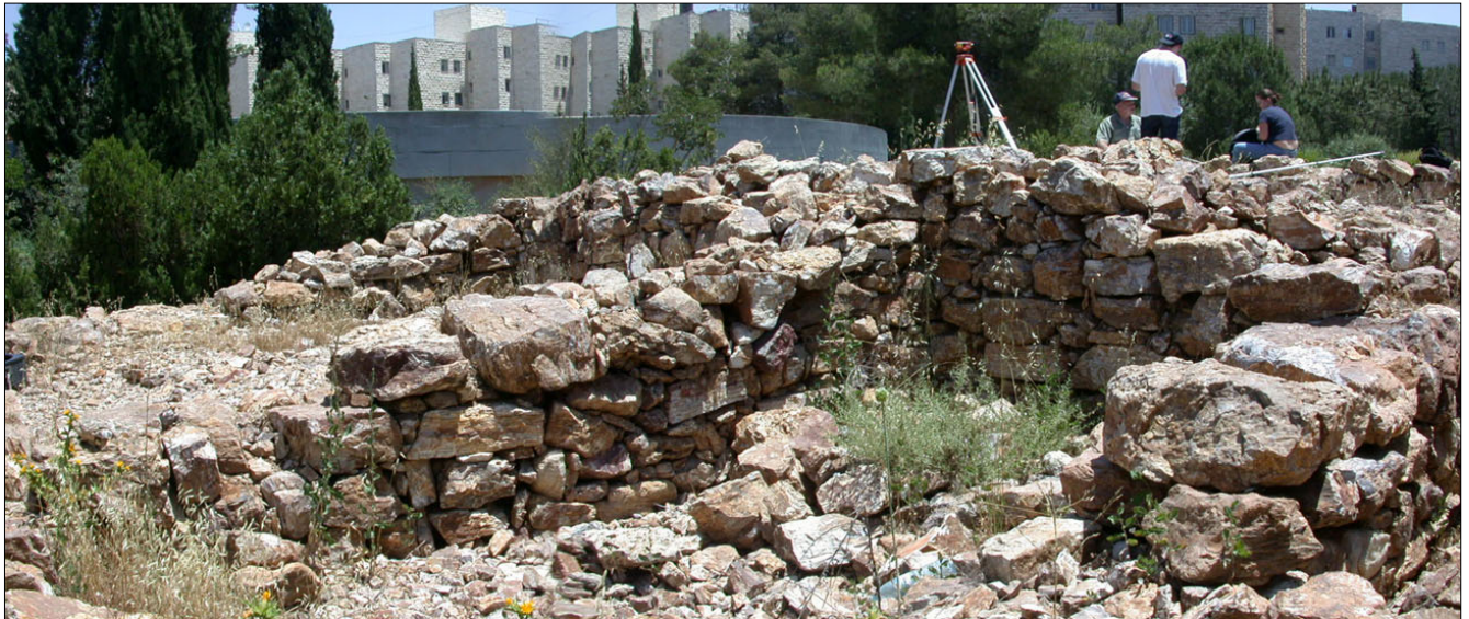
חדרים מערביים : מבט מדרום מערב