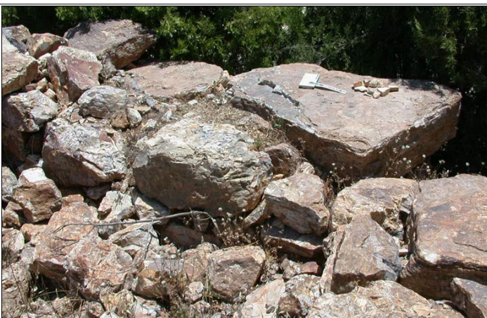
בנייה באבני צור