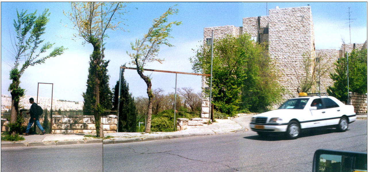
הכניסה לגן בו ממוקם האתר.