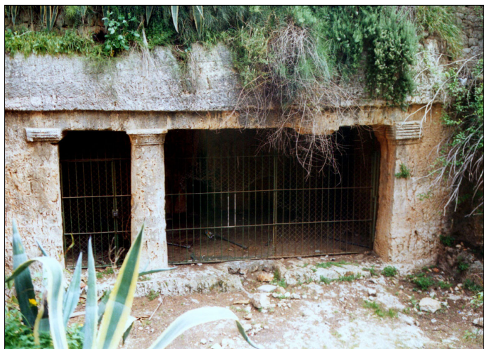
חזית מערת קבורה