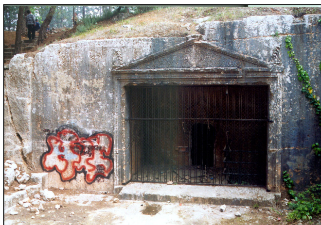
חזית "מערת הסנהדריין"