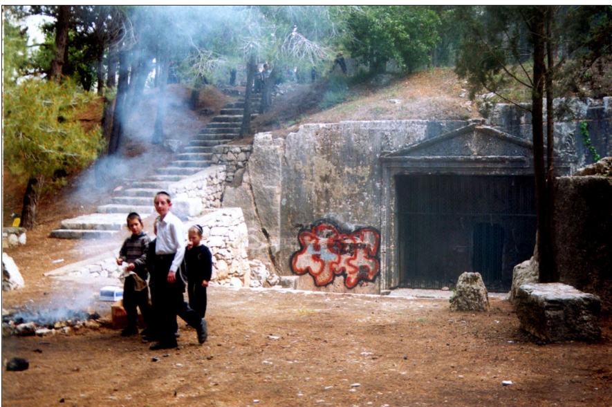
קברי הסנהדרין: חזית המערה

תאור הממצאים: מספר רב של מערות קבורה מפוארות חצובות בסלע, מהמאה ה-א' לסה"נ. לקבר המרכזי והגדול חזית מפוארת, מוקפת מסגרת מכוירת שמעליה גמלון בעל אקרופוליס. בגמלון עלי אקנטוס, רימונים, גפן ופירות נוספים. בחזית המערה נחצבה חצר, ששפסלים לאורך דפנותיה. במערכת שבעה חדרים בשני מפלסים. בדפנות החדרים נחצבו 57 כוכי קבורה, 6 מקמרים ו-3 כוכים לליקוט עצמות. המערכת מפוארת במיוחד, גם במידותיה וגם בעיטוריה, והיא נשתייכה ככל הנראה למשפחה גדולה ועשירה בסוף ימי בית שני. מערות נוספות: מערה של חדר מבוא וארבע חדרי קבורה, מערכת דומה בעלת שלושה חדרי קבורה, שלוש מערות קבורה שלהן מבוא משותף וכל אחת מהן מכילה מכלול של שני חדרים. מערות אלו נחצבו כאמור, ככל הנראה באמצע המאה ה-א' לסה"נ, ויצאו מכלל שימוש בשנת 70 לסה"נ.