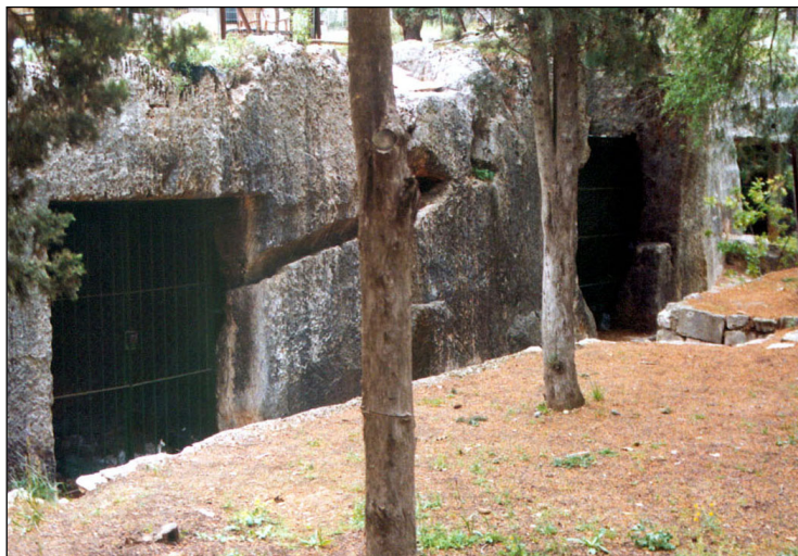
חזיתות מערכות קבורה סמוכות