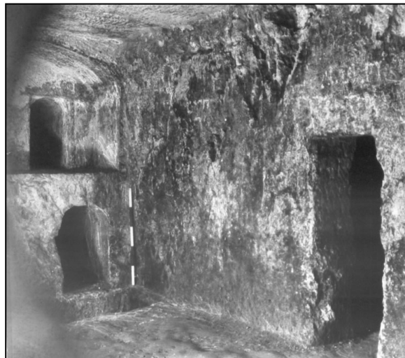
פנים המערה