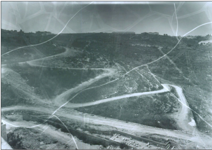
מעלה רומאים