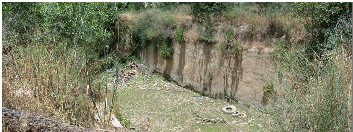
בריכת אגירה (עות'מנית?)