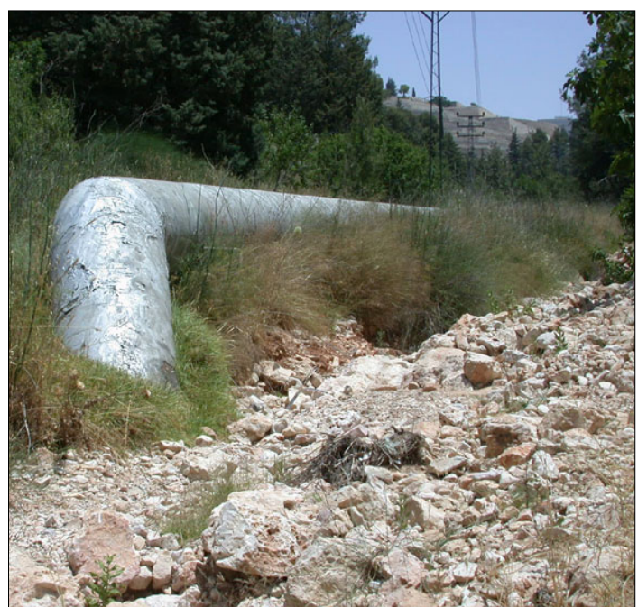
צינור ביוב בצד שרידי הדרך