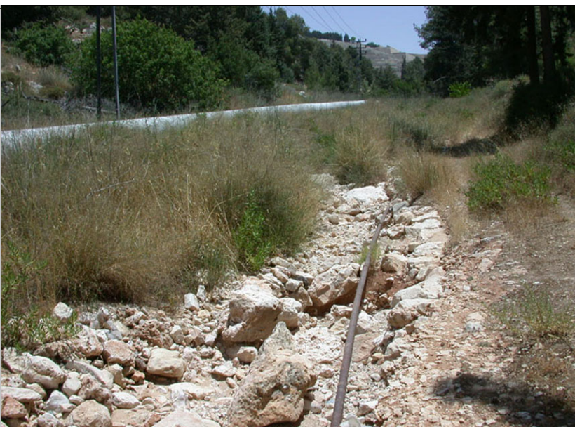
שרידי הדרך כיום

הדרך נסללה בדומה לטכניקה המקובלת: ניקוי וישור התוואי, הנחת אבני שפה בשוליים ומילוי החלל שביניהם בשכבת תשתית, ומעליה ריצוף. ריצוף הדרך התבצע, ככל הנראה, בעזרת אבנים שטוחות או מיושרות שהותאמו זו לזו, או בשכבת חצץ, חלוקי נחל וכו'. (ע"פ ישראל רול)