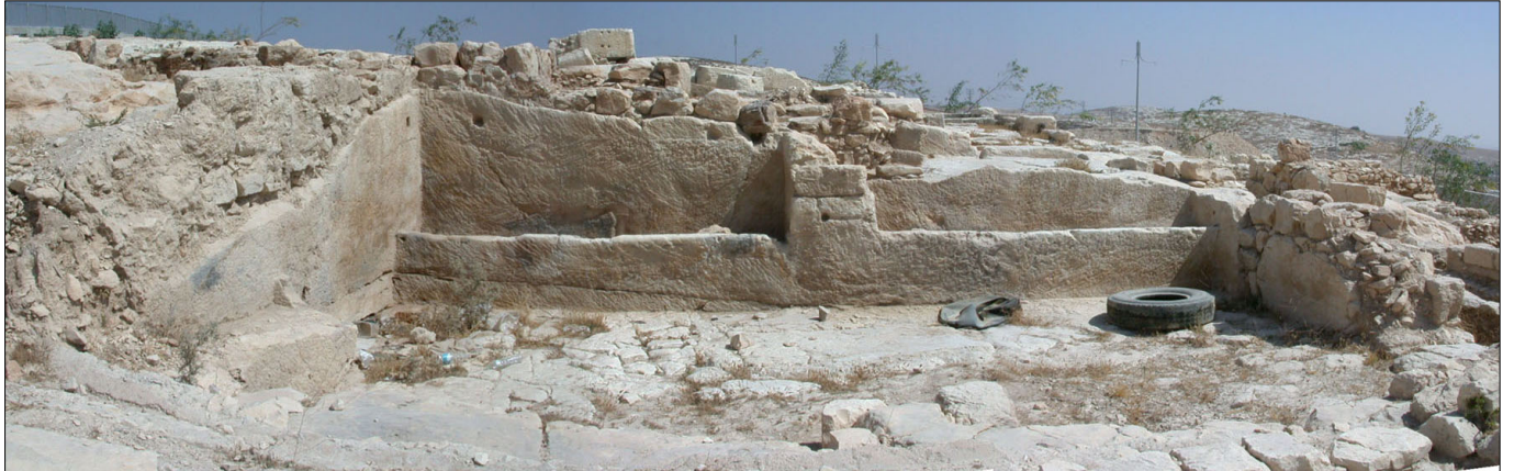
מתקנים בנויים בדופן אולם