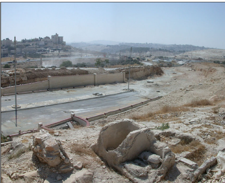
שרידי המנזר, ברקע: הכביש למעלה אדומים

שרידי אורות, מחסנים, בית מרחץ ובית בד. המנזר כולל מערכת לאגירת מים מסועפת לאיסוף מי נגר הכוללת שתי בריכות גדולות (נפחם קרוב ל- 2400 מ"ק), בורות תת קרקעיים, תעלות, צינורות ומרזבים. מערכת קבורה תת קרקעית וקברים בנויים.