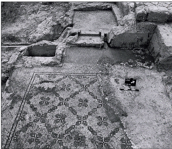
חדר ההלבשה (?), מתוך: ח"א 112