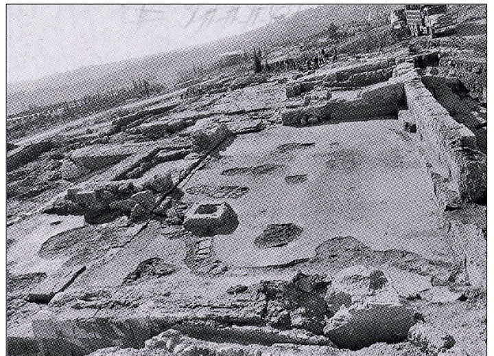
אולם המבוא לכנסייה.