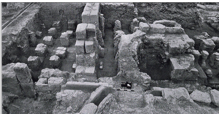
בית המרחץ, מתוך: ח"א 112