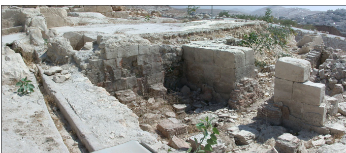
בית מרחץ (חדר חם)