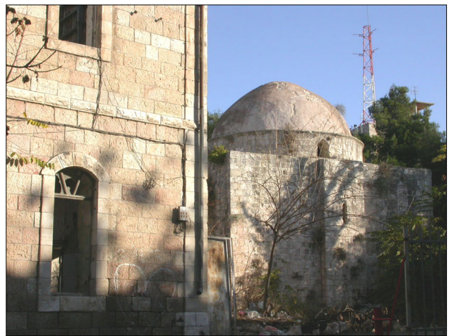
מבט מרח' פראג