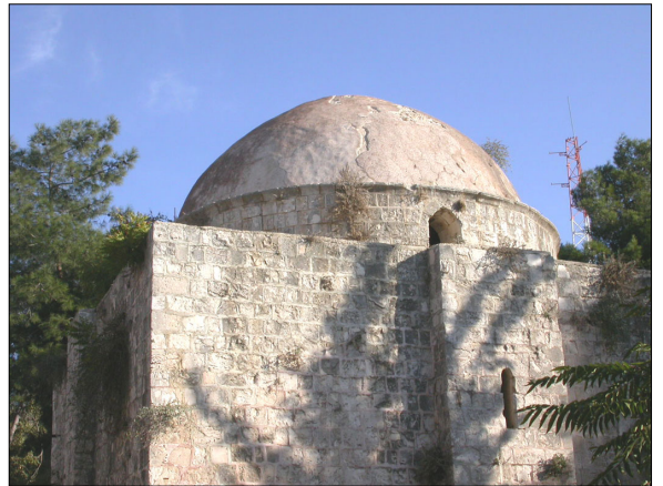
הקמרייה: תוף וכיפה.