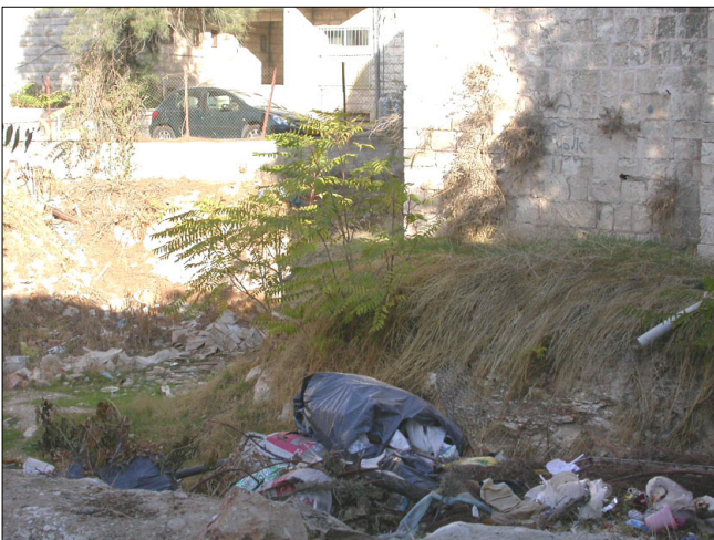
תעלה חפורת, סמוך לקמרייה