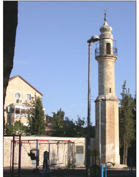
נבי עכאשה: צריח