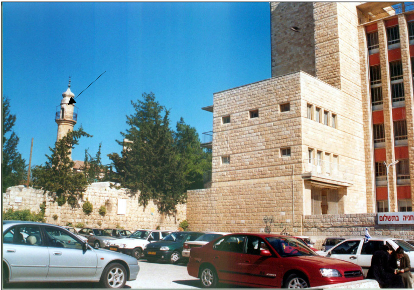
מבט מרח' שטראוס לצפון מערב