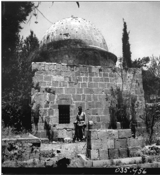
ה"קבקה". מתוך: תיק מנדט 108, רעיית.