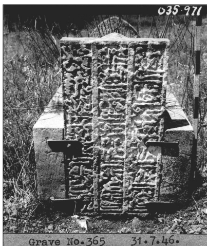
מצבה ממלוכית. מתוך: תיק מנדט 108, רעיית.