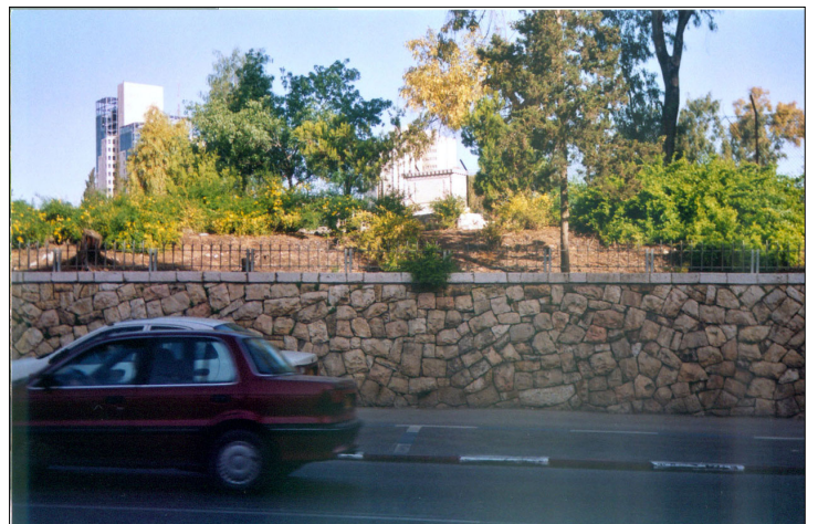
מבט מכיוון רח' אגרון