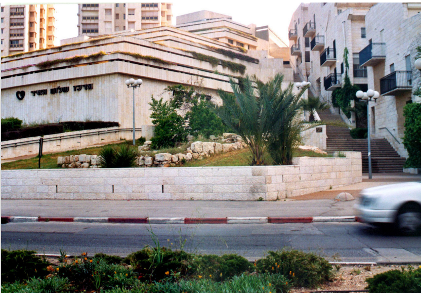
האתר על רקע 'מרכז שלום מאיר'

שרידים של מצד או מגדל שמירה המתוארך ככל הנראה לתקופה הממלוכית. המבנה בנוי אבן גויל ופתחו לכיוון צפון. קירות המבנה נשתמרו עד לגובה של מטר ויותר ופינות המבנה חוזקו ע"י נדבכים פנימיים. כן נמצא ספסל בנוי בקירו המזרחי של המבנה. המצד משתלב ככל הנראה במערכת מתקני ההגנה שהקיפה את ירושלים. אפשר שהמבנה שימש גם בתקופה העות'מנית (ע"פ סקר ירושלים). במקור, ניצב המבנה בשטח עליו נבנו מגדלי וולפסון. שרידי המבנה פורקו ונבנו מחדש באתר הנכחי, סמוך ל'מרכז שלום מאיר'.