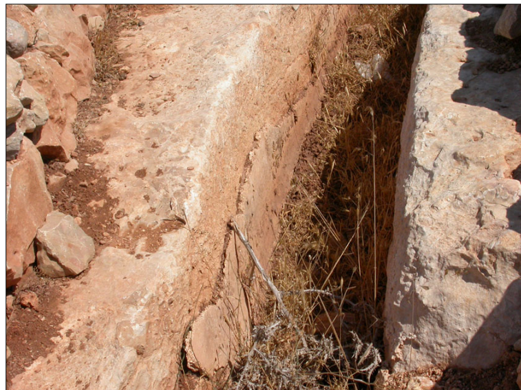
שרידי טיח באמה החצובה.