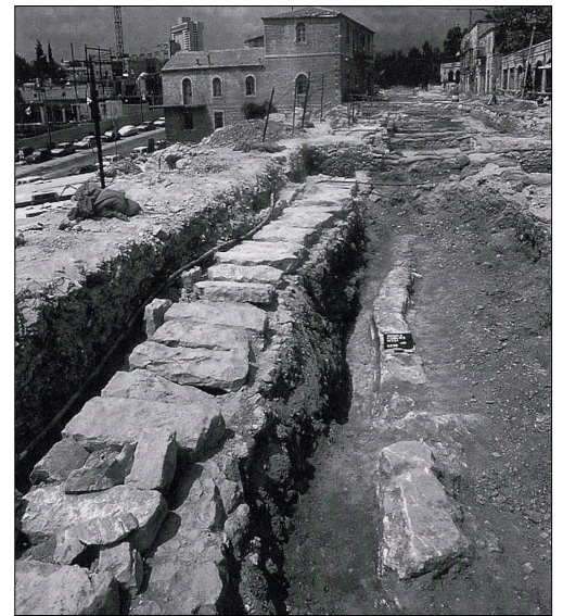
קטע מהאמה ברח' ממילא. מתוך: ח"א 107