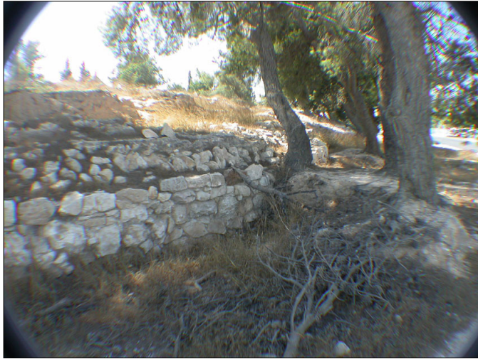
האמה וסביבתה הקרובה.