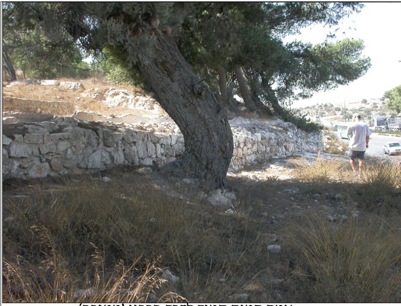
אמת המים סמוך לדרך חברון (ממזרח).

האמה נבנתה על גבי יסוד מוצק ורחב. וטויחה מבפנים ומבחוץ. חתך האמה צורתו צורת האות U. ממערב לדרך חברון: שרידי האמה החצובים בסלע וטוחים מפנים בטיח אטים למים. במרחקים קצובים הותקנו מרזבים לניקוז המים שהצטברו מאחורי האמה, דרך קיר היסוד אל המדרון.