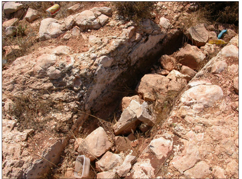
האמה החצובה, מערבית לדרך חברון.