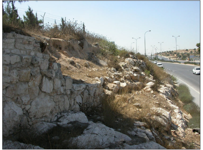
האמה והמשכה הלא-משוחזר, מבט לכיוון דרום.