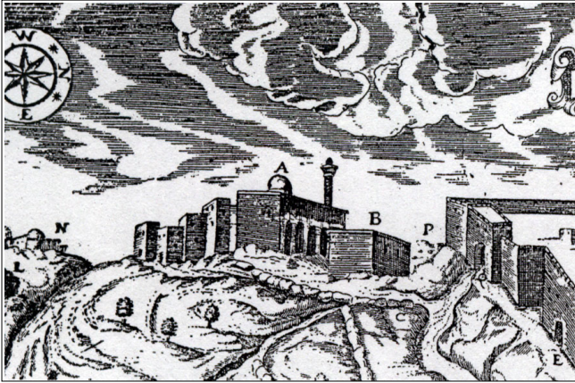
קבר דוד : המאה ה-17 לסה"נ