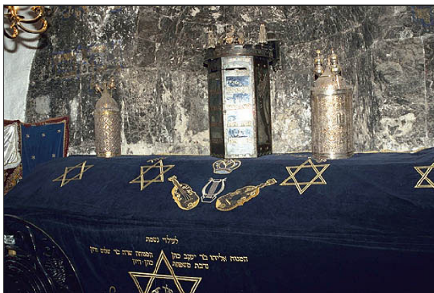
קבר דוד, ציון הקבר

הזיהוי הראשון של האתר, כמקום קברו של דוד, מופיע במקורות מוסלמיים בני המאה ה-10. הידיעה הראשונה ממקור נוצרי נמסרת בשלהי המאה ה-11 אגב תאור המצור הצלבני בשנת 1099. בספרות העברית נזכר המקום לראשונה ע"י בנימין מטודלה, המספר כי "בהר ציון קברי בית דוד וקברי המלכים אשר קמו אחריו ואין המקום ידוע". סמוך לסופה של התקופה הצלבנית מתווספת מסורת יהודית נוספת המזהה את המקום כמקום ארון הברית טרם הבאתו לירושלים. בתקופה הצלבנית התחזקה המסורת אודות קברו של דוד והצלבנים טרחו להראות כי בקומה התחתונה, מתחת לאולם הסעודה האחרונה, מצוי קברו של דוד. במאה ה-15, לאחר כמה מאות שנים של חורבן, בקשו היהודים תושבי הרובע לקנות את המקום, למורת רוחם של הנזירים הפרנציסקנים. בעקבות הסכסוך נטל הסולטן את המבנה כולו תחת חסותו והפך את אולם הסעודה האחרונה למסגד (ראה אתר מס' 60). המקום נמסר, לאחר מכן, למשפחת דגיני שהמשיכה להחזיק במקום עד למלחמת השחרור. המקום שימש לתצפית לכיוון הר הבית בין 1948 ל-1967. מבנה הקבר מצוי בתוך מתחם שהקמתו מתוארכת לתקופה הצלבנית. במשך השנים נוספו חדרים רבים, רובם בתקופה העות'מאנית.