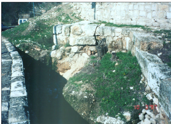
שרידי חומה (במהלך ביצוע עבודות שימור. כיום : מכוסה חלקית)