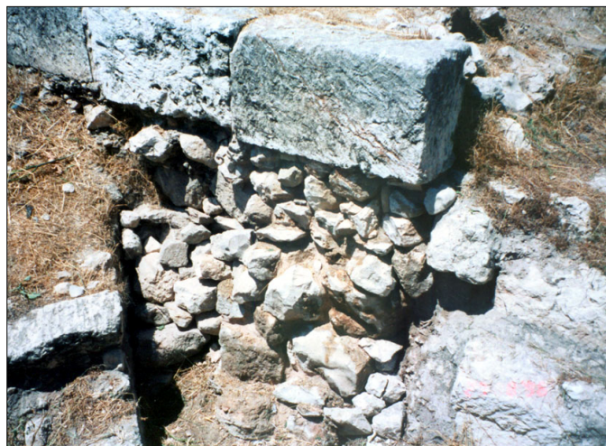
שרידי חומה (במהלך ביצוע עבודות שימור. כיום : מכוסים)