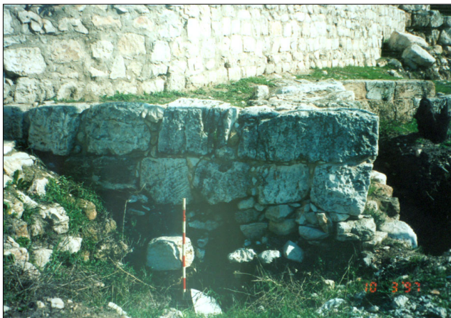
שרידי חומה (במהלך ביצוע עבודות שימור. כיום : מכוסה חלקית)