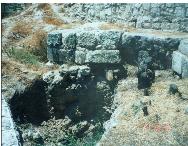
שרידי חומה (במהלך ביצוע עבודות שימור. כיום : מכוסים)