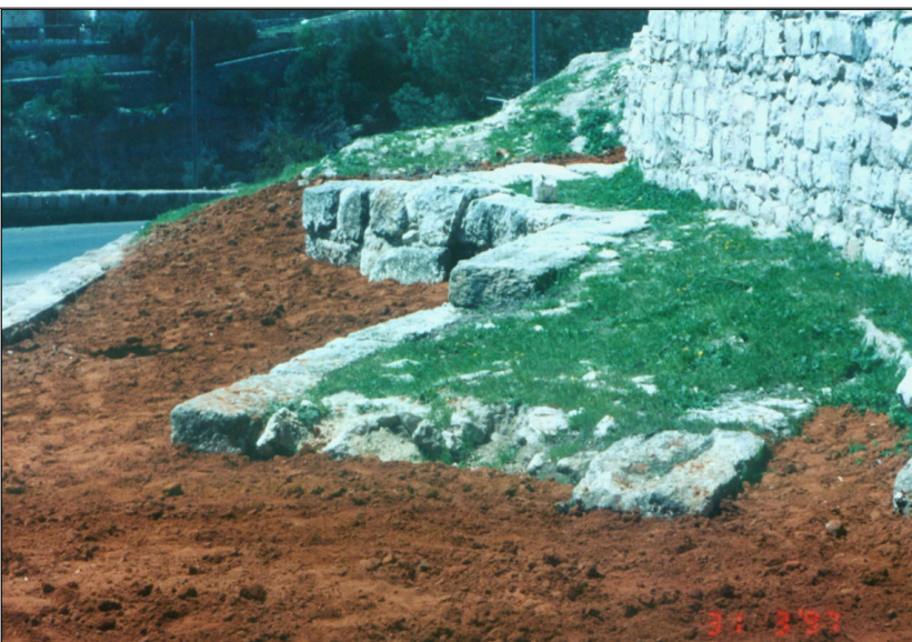
מראה כללי מחוץ לחומת ביה"ק