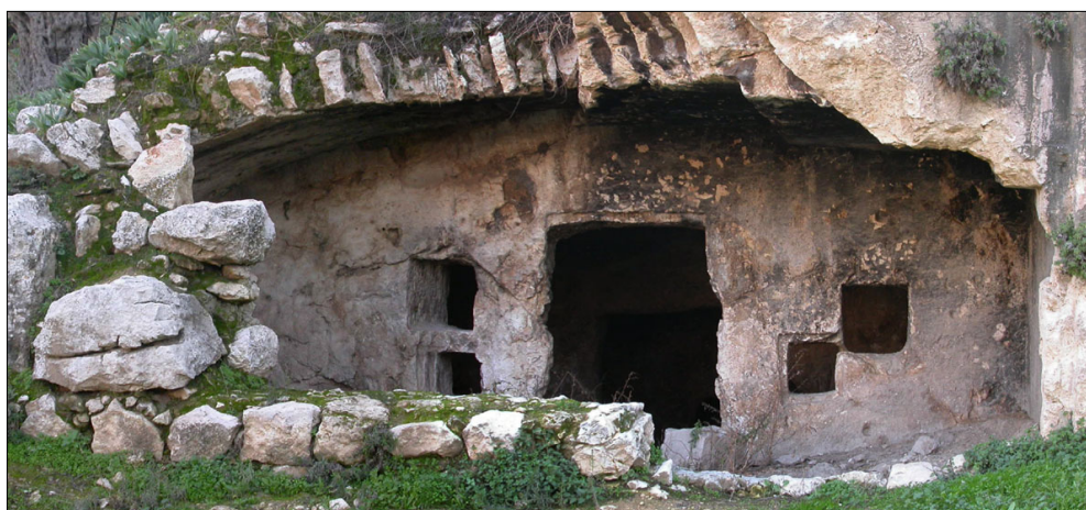
מערת קבורה: חזית