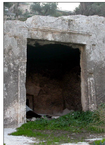
מערת קבורה: שער