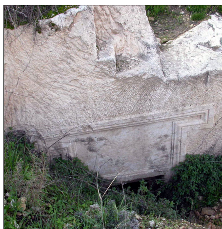
מערת קבורה: עיטור שער הכניסה