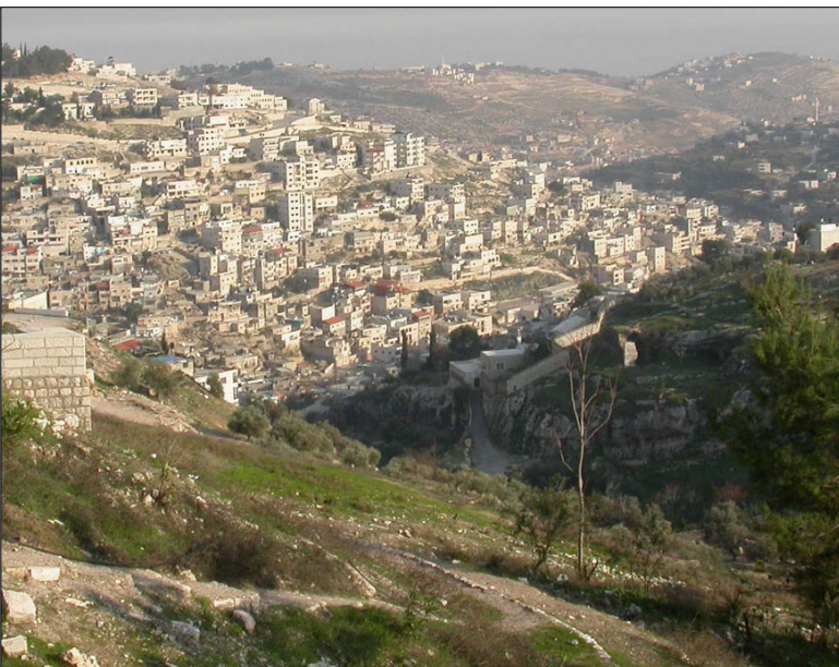
גיא בן הינום: מראה כללי