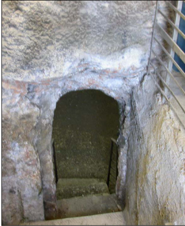
ירידה למערת קבורה, "סנהדרין הקטנה"