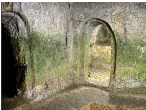
פנים המערה, "סנהדרין הקטנה"