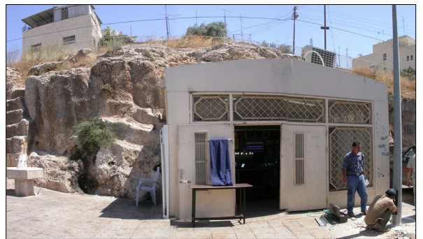
חזית מבנה הקבר (המבואה המודרנית)