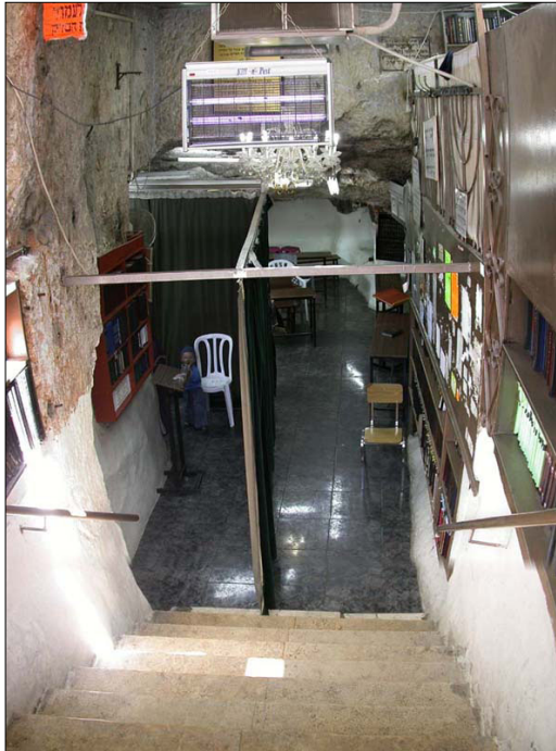
הכניסה למערה, "שמעון הצדיק"