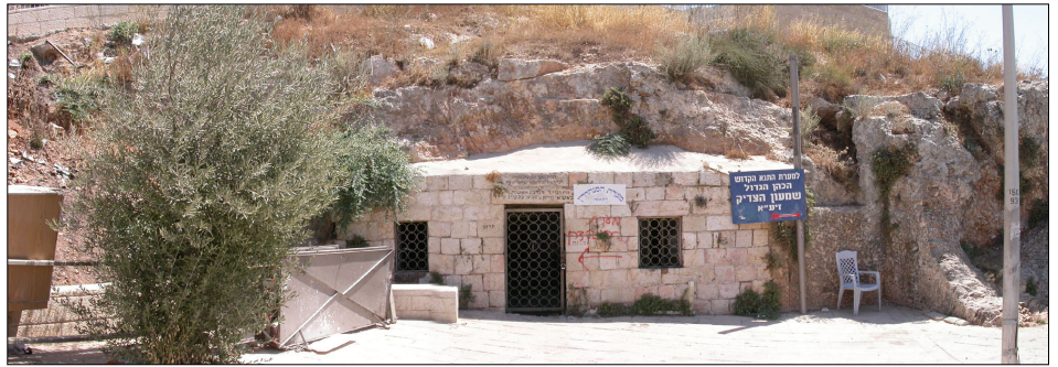
חזית מערת "הסנהדרין הקטנה"