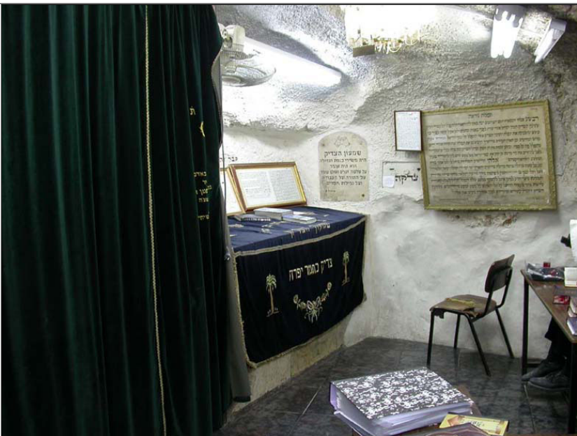
קבר שמעון הצדיק