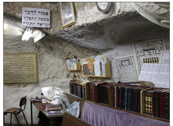
הסדרת חלל המערה כמקום תפילה