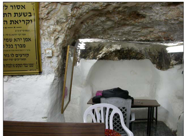
שרידי ארקוסוליה, "שמעון הצדיק"