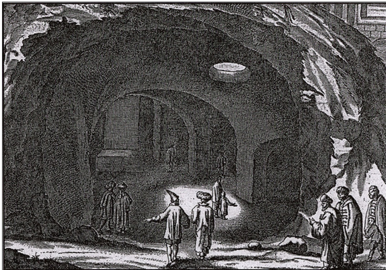
תחריט מהמאה הייז (Dapper 1677)