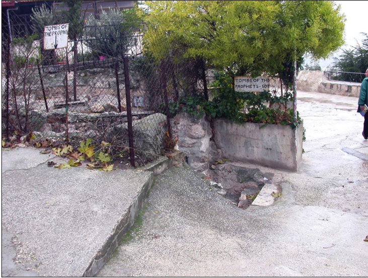
סביבת האתר הקרובה