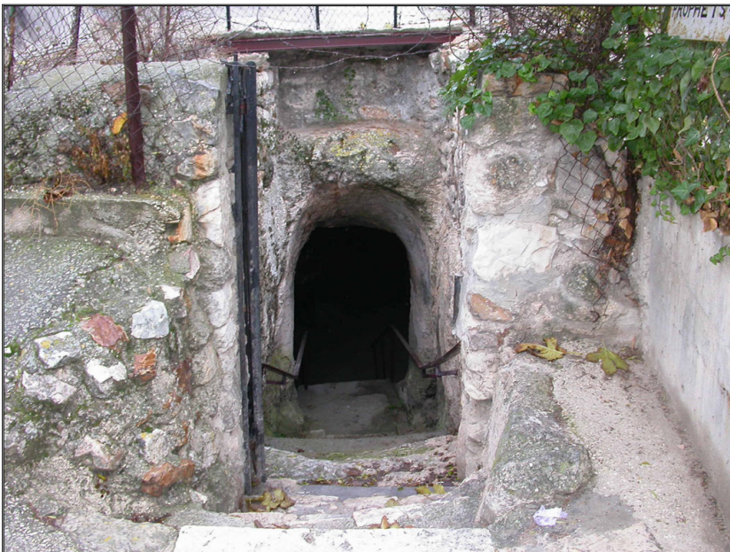
פתח הכניסה למערכת הקבורה

מערכת קבורה חצובה ומטוייחת בהר הזיתים. במערכת אולם מרכזי עגול, ששלושה מסדרונות רדיאליים נמשכים ממנו לשלושה צדדים. המסדרונות מקושרים ביניהם בשני מסדרונות היקפיים דמויי סהר. בדופנות החדר המרכזי חצובות ארבע גומחות. בתחתיתה של כל גומחה חצוב אגן דמוי כדור וממנו יוצאים צינורות חרס. בדפנות המסדרון ההיקפי חצובים 28 כוכים. בדפנות הכוכים נחצבו משכבי קבורה. בקצה המסדרון הרדיאלי המרכזי חצובים שני חדרים וכוך קבורה. בשאר המסדרונות חצובים כוכים נוספים (סה"כ כ-36 כוכים). מסורת עממית קושרת מערה זו לנביאים חגי זכריה ומלאכי. באתר נתגלו כתובות ביוונית. באחת הכתובות נכתב: "פה שוכב אנאמוס מפלמירה וכן היה שמח בחלקך אותריוס אין אדם בן אלמוות". האתר נרכש ע"י הכנסייה הרוסית בשנת 1890. יש הסבורים כי המערכת הותקנה כבר בימי בית שני, כמערכת קבורה ציבורית. המחקר החדש (אבני ג', זיסו ב') מחזק את דעתו של קלרמון-גנו שתיארך את המערכת לתקופה הביזאנטית, והסובר שהמערה שמשה ככל הנראה לקבורתם של עולי רגל נוצריים. כמו כן, סימנים שונים מעידים כי יתכן והמערה במקורה נועדה לא לקבורה אלא לשימוש שונה.