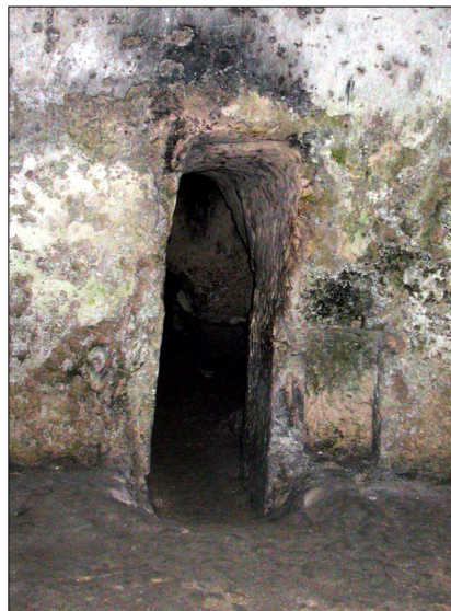
כניסה לאחד מהמסדרונות ההיקפיים