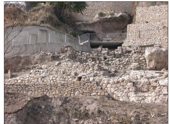
שרידי חומות, דרומית לביית המעיין