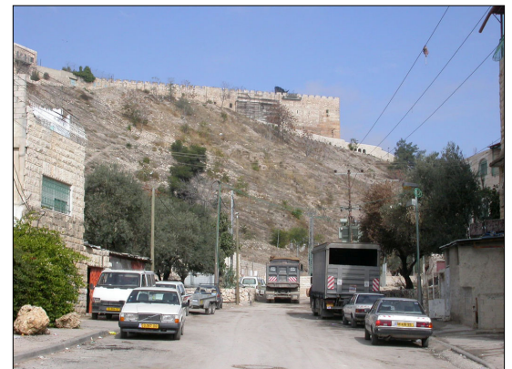
מורדות התל, סמוך לערוץ הקדרון