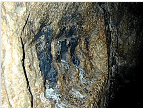
מקום כתובת השילוח