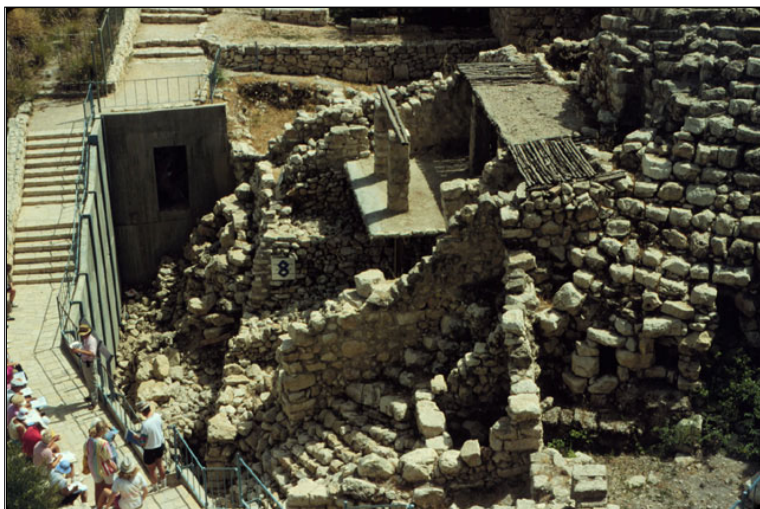
עיר דוד, שטח G

תקופות: כלכוליתית, ברונזה קדומה, ברונזה תיכונה, ברונזה מאוחרת, ברזל ב', פרסית, הלניסטית, חשמונאית, הרודיאנית, רומית, ביזאנטית, ערבית קדומה רמת השתמרות: גבוהה ממצא מיוחד: כתובת השילוח פוטנציאל לחפירה עתידית: 1, 2, 3, 4, 5