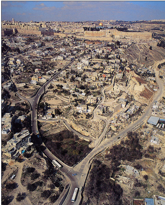
מראה כללי.