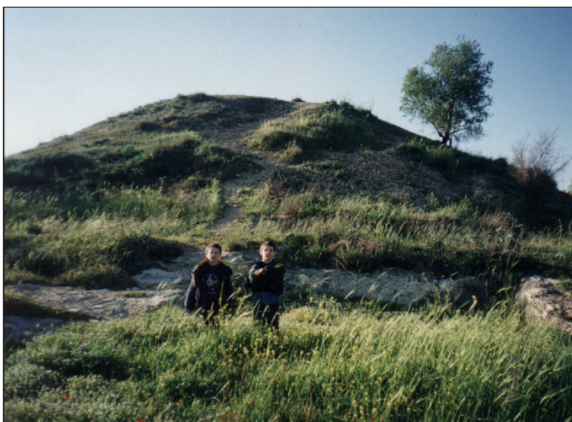
רוגם גנים – מבט ממזרח

המתקנים: במהלך החפירה הארכאולוגית, נחשפה בצידו הדרום מזרחי של הרוגם מערכת מתקנים ליצור יין: גת (משטח דריכה, בור איגום ובור שקיעה), בורות איכסון מערות ועוד. המערכת פרוסה על פני ארבע מדרגות סלע. במדרגת הסלע השלישית קיימת מערכת מורכבת הכוללת משטחי דריכה ובורות איגום המקושרים למשטחי הדריכה בעזרת תעלות מקורות. במדרגה השנייה מצויה גת שהורחבה ורוצפה בפסיפס. שני גלילי אבן מוטלים בבור האיגום של גת זו. בכל שטח האתר ניתן להבחין בסימני חציבה משנית ובעדויות לפירוק מדרגות ורצפות. ניתן לזהות פעילות בשטח זה החל מתקופת הברזל ועד לתקופה הביזאנטית. (ע"פ ר. גרינברג)