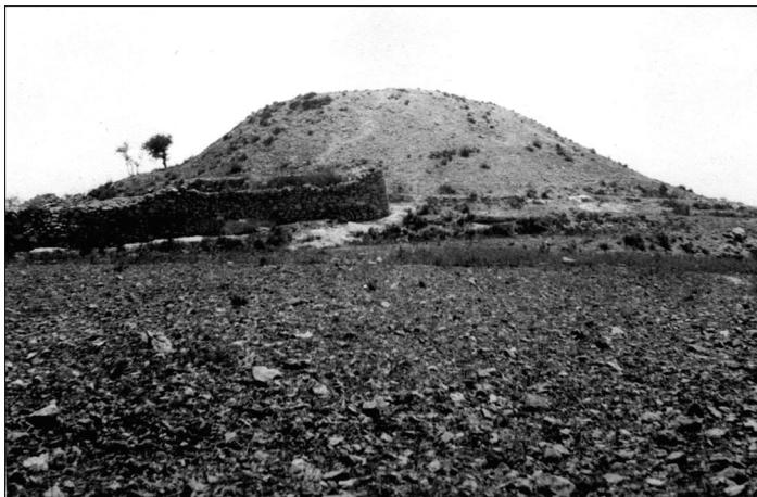
מתוך תיק מנדט