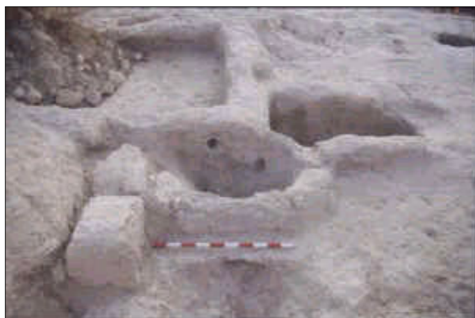
משטח דריכה, בור שיקוע ובור איגום.