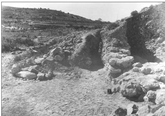
האתר בזמן החפירה, מתוך ארכיון הצילומים של רשות העתיקות