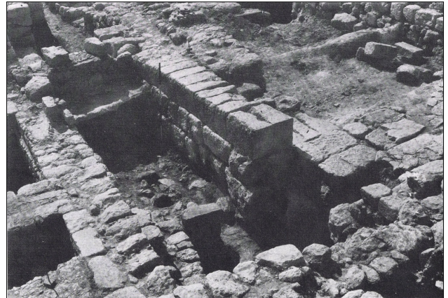
אחת מאומנות השער של המצודה הפנימית. מתוך: אנציקלופדיה חדשה לחפירות ארכיאולוגיות