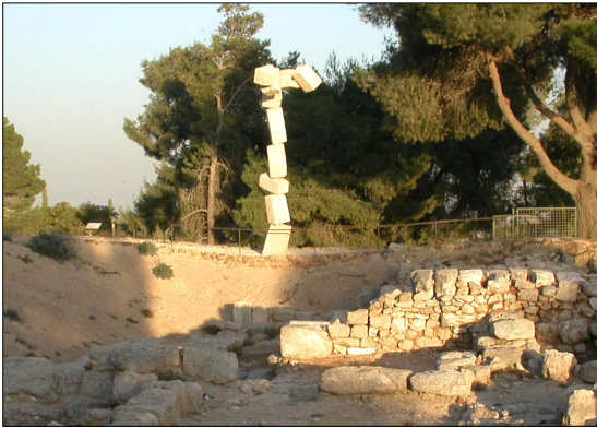
פיסול סביבתי באתר