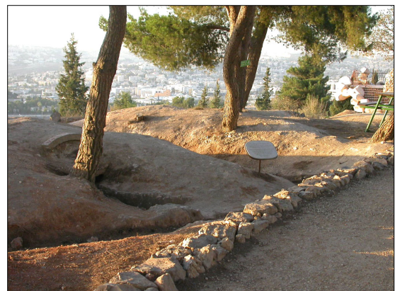
בשולי האתר: חורשה ותצפית