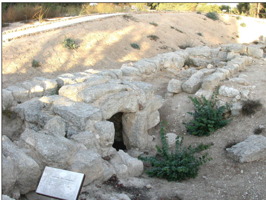
"מעבר סתרים", המצודה