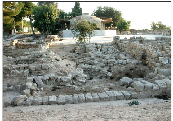
המצודה: מבט מצפון