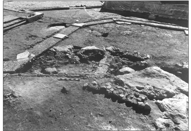
האתר בזמן החפירה