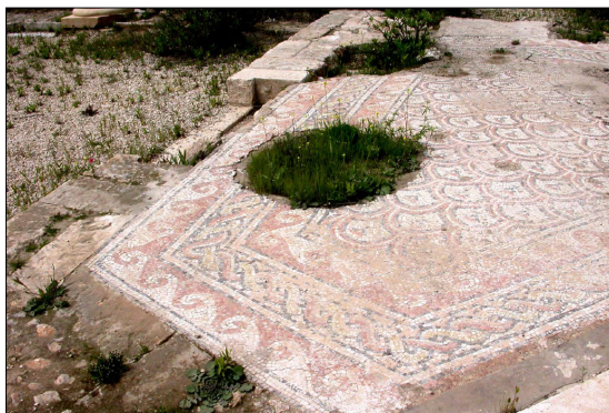
רצפת פסיפס, סמוך לקפלה הצפון מערבית