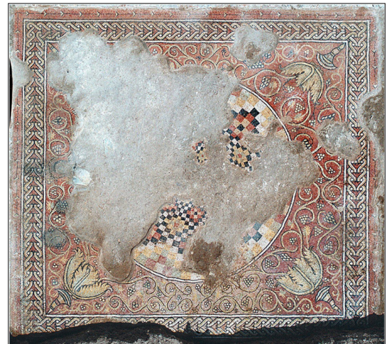
רצפת פסיפס, חדר דרומי