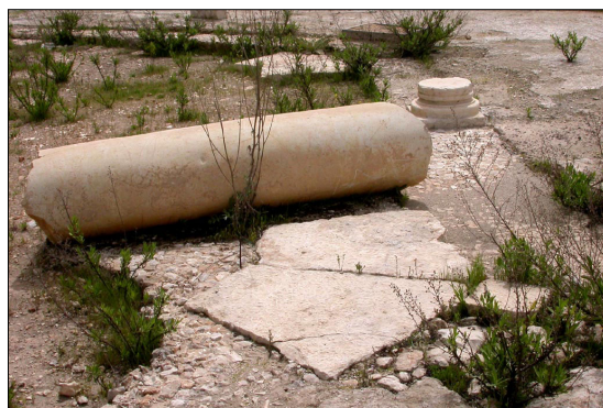
בסיס לאומנה בעלת חתך "לב".