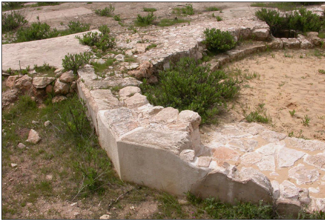
פינת הקפלה הצפון מזרחית