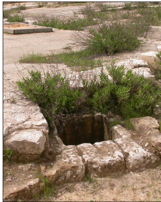
בור מים, סמוך ל"יבמה"