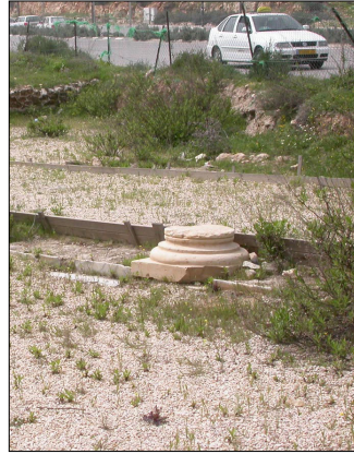
סמיכות לרח' דרך חברון