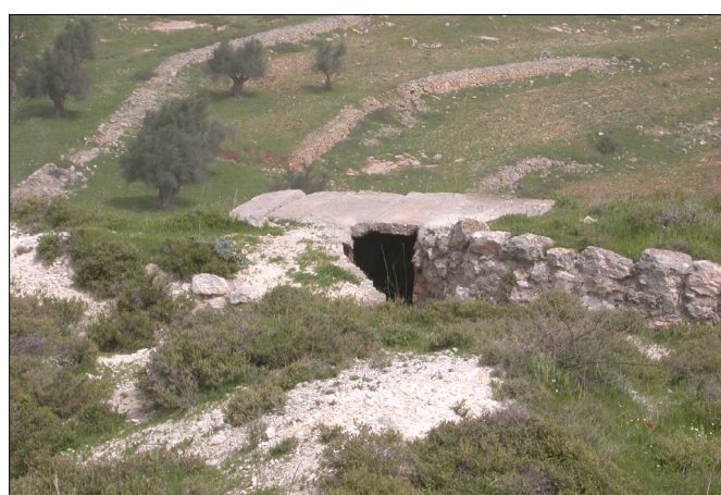
עמדה ירדנית סמוך לפסגת הגבעה