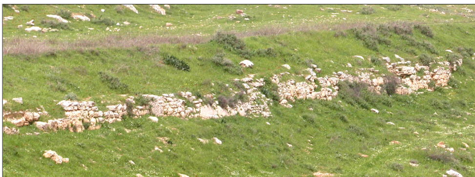
אמת המים התחתונה