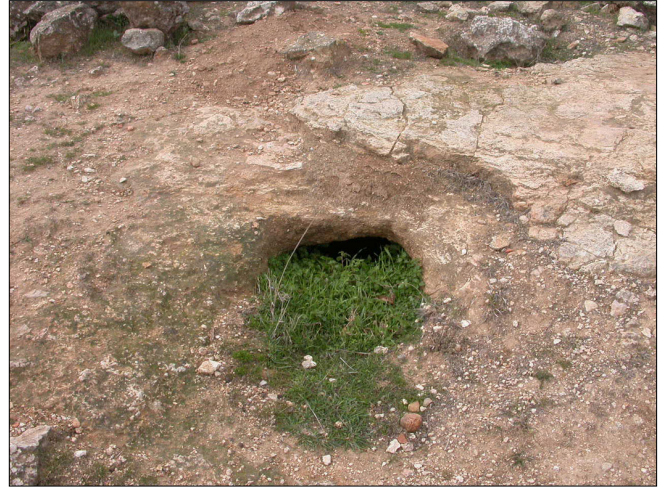
פתח בור מים