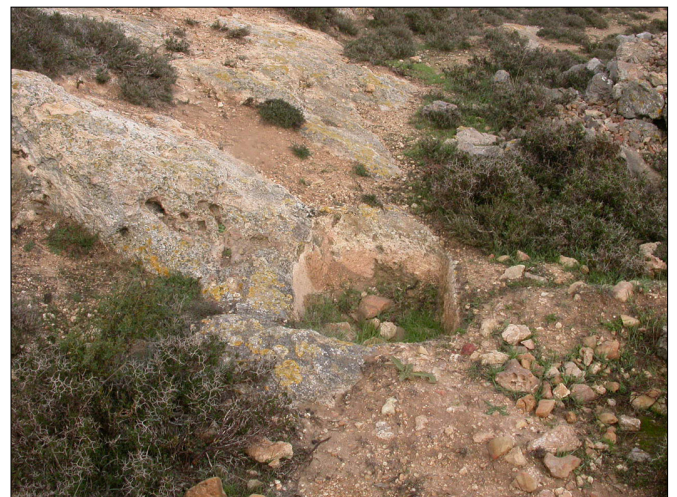
בור חצוב בסלע