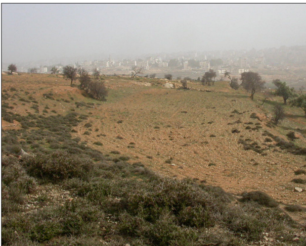
מבט מהאתר לכיוון מזרח