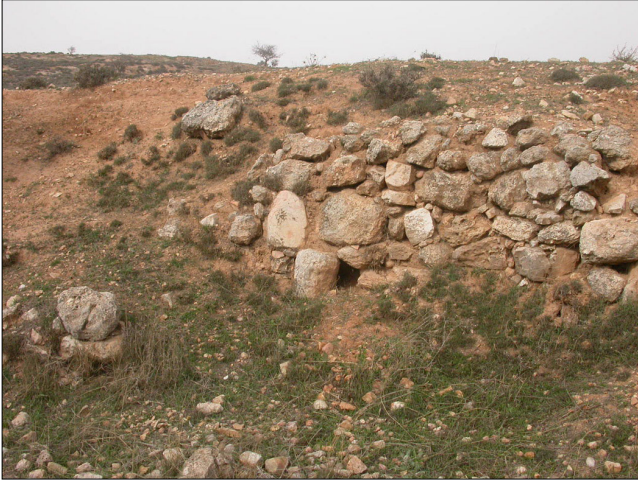
שרידי קיר בנוי