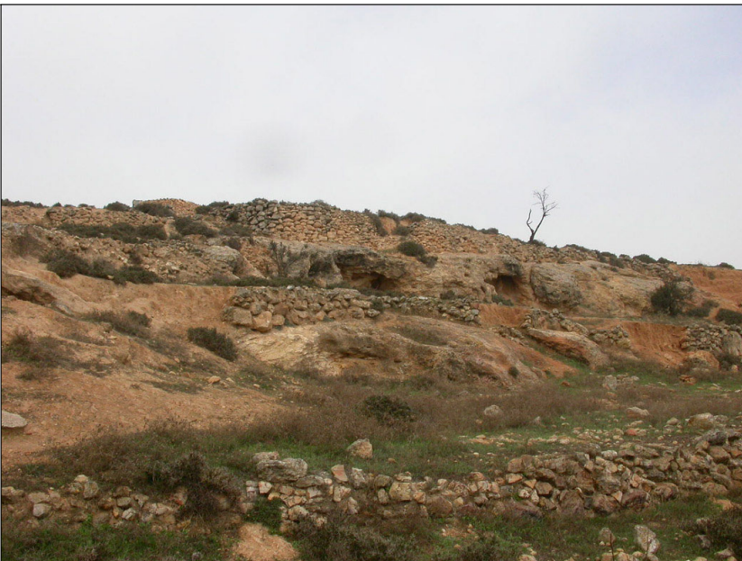
חר' עדאסה: מדרגות עיבוד

תאור הממצאים: בורות, בריכות מים, מדרגות עיבוד רבות. בעבר תועדו במקום זה עמודים ורצפות פסיפס. מדרום לפיסגת הגבעה: שרידי מערות חצובות בסלע ששימשו ככל הנראה לקבורה ולחציבה כאחת. ממערב: חלל גדול, חצוב, ששימש ככל הנראה כמאגר מים. ממזרח: מערה נוספת, ומאגר מים גדול חצוב בסלע ומעליו קמרון בנוי. תעלה תת קרקעית, באורך של כ-15 מטר חצובה עד סמוך למאגר אך איננה קשורה אליו. בפסגת הגבעה נחשפו יסודות של בניין/מגדל, כמו כן נחשפו שברי עמודים מאבן גיר. מספר גתות חצובות בולטות בשטח וכן שרידים דלים של פסיפס. "...הקברים, מאגרי המים, ושאר האלמנטים, מלמדים כי השרידים (הנראים) מצביעים על אתר עתיקות חשוב" (Conder and Kitchener, 1882)