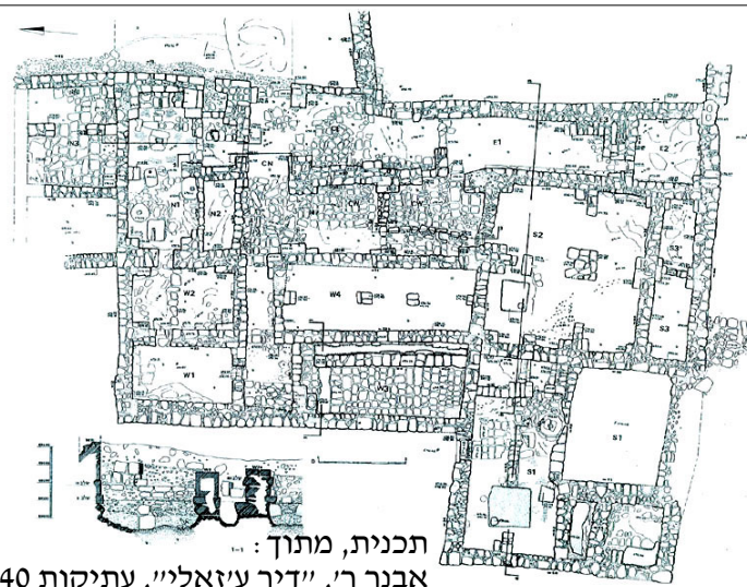
תכנית, מתוך: אבנר ר', "דיר ע'זאלי", עתיקות 40