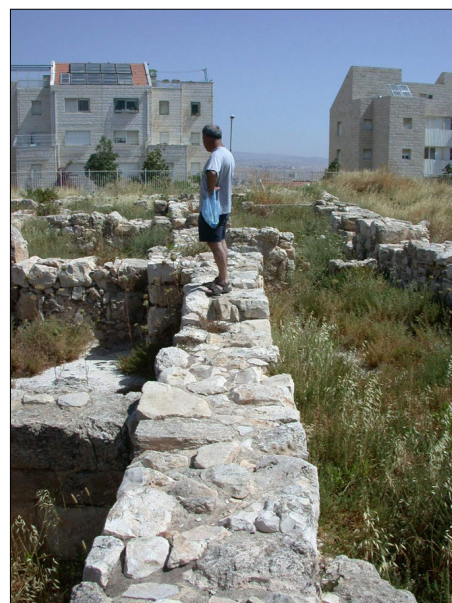
הקיר החיצוני: מבט ממערב.