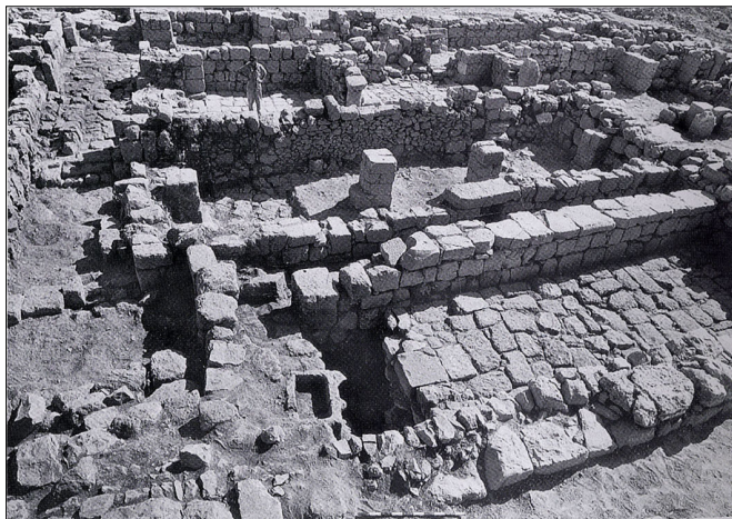
האגף המערבי, מבט לדרום מזרח, מתוך עתיקות 40