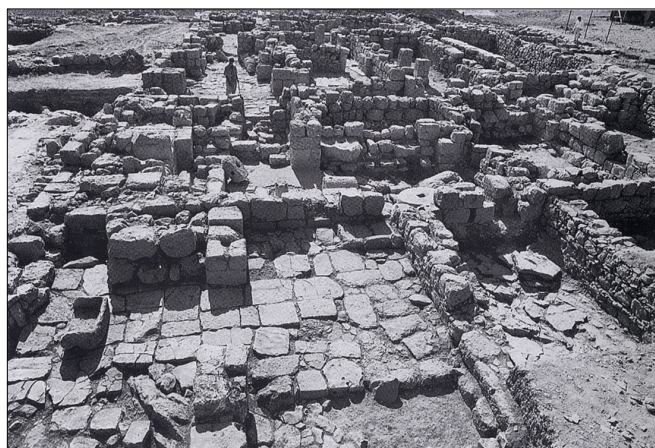
מתוך עתיקות 40