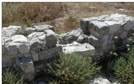
שרידי חלון (?) בקיר המזרחי