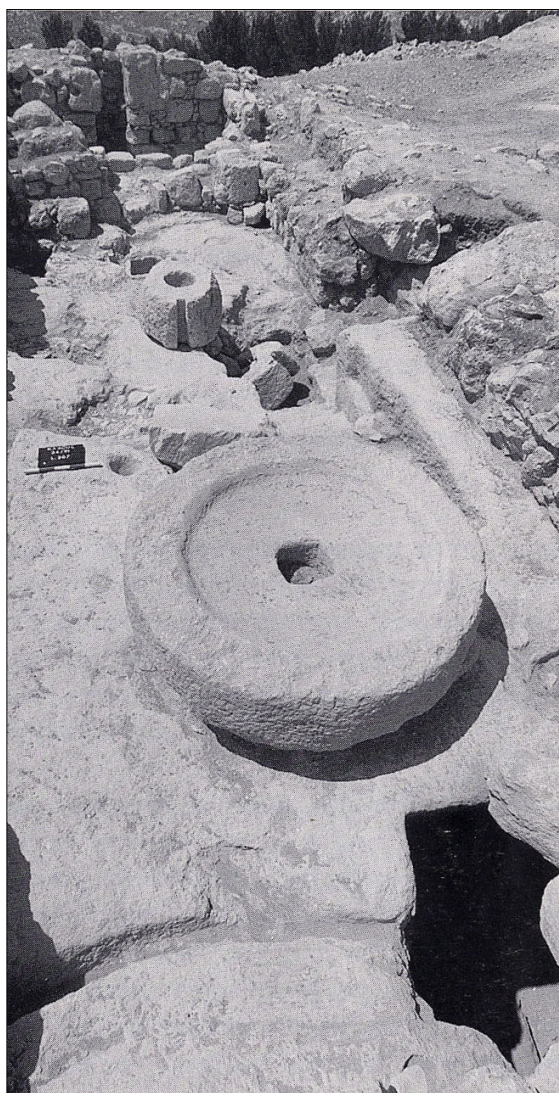
שטח 1B : בית בד, מתוך ח'יא 100