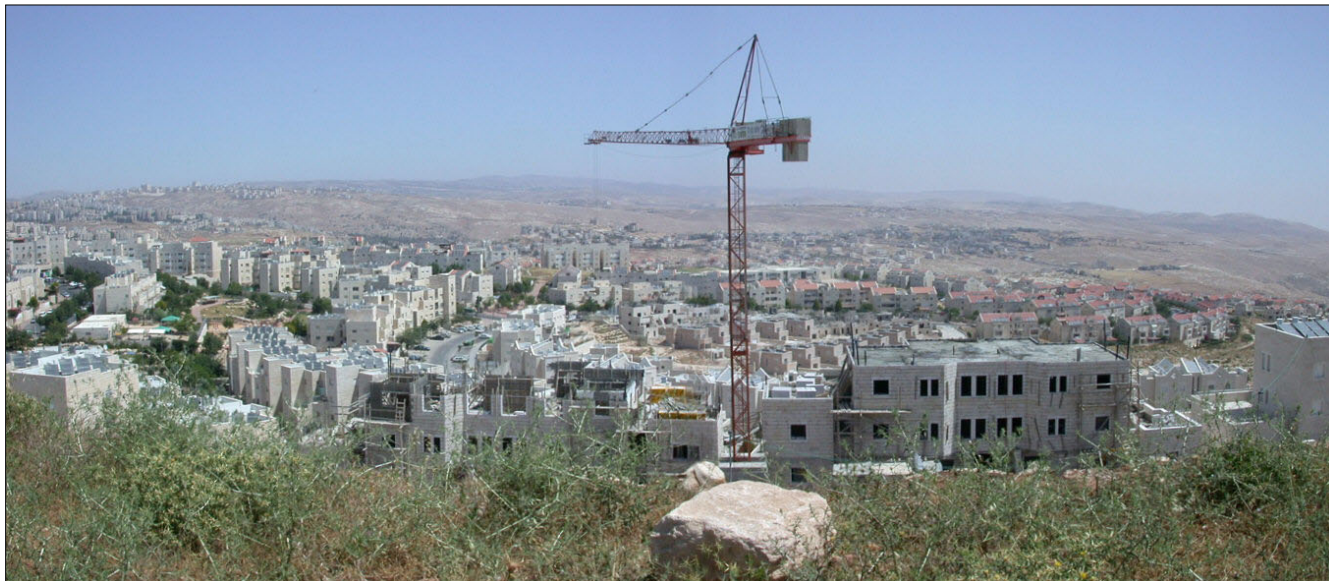
תצפית מהאתר : מבט מזרחה.