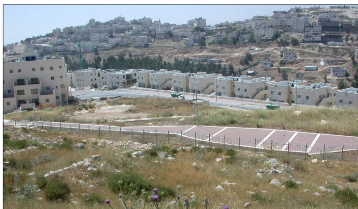
הקשר סביבתי : סמיכות לשצי"פ.