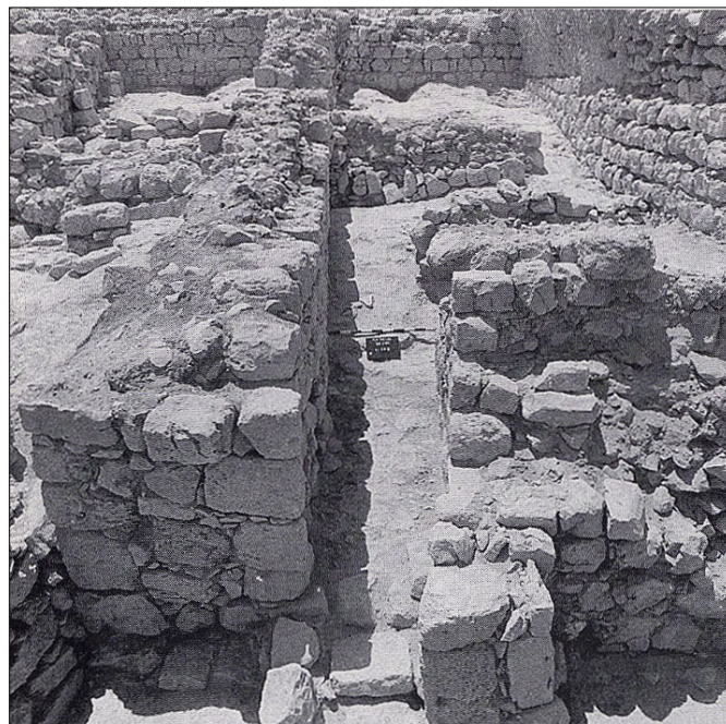
שטח A : חדרים שקורו בקמרונות, מתוך : ח'יא 100