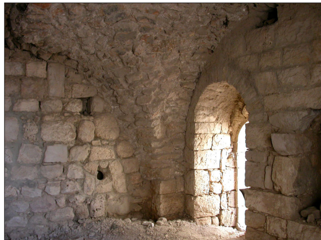
'גרעין הכפר', פנים מבנה