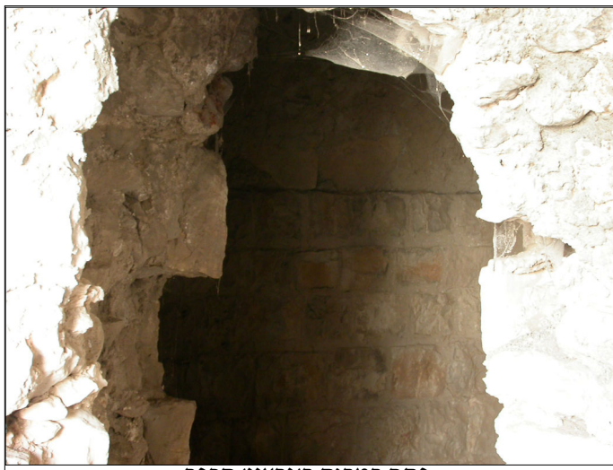
פתח במבנה ב'גרעין' הכפר