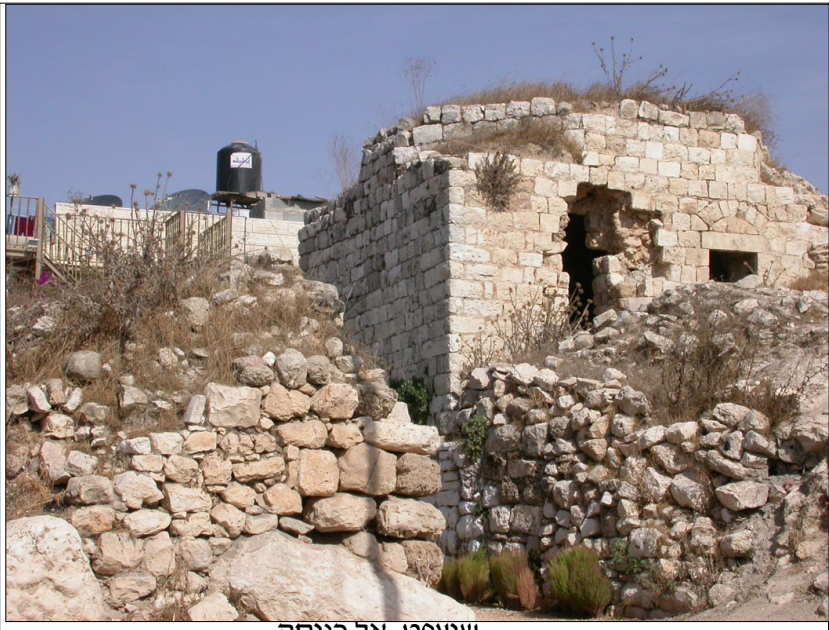
שועפט, אל כניסה

תאור הממצא/ים: 1. שרידי מבנים המהווים את 'גרעין' הכפר ההיסטורי, ככל הנראה מהתקופה העות'מאנית. 2. מבנה בעל קמרון 'חביתי' מוארך. הקמרון בנוי קשתות אבן גזית וביניהם בניית גויל. המבנה מתוארך, ככל הנראה, לתקופה הצלבנית, ומהווה דוגמא למערך בתי החווה והמנזרים שנבנו בתקופה זו. בהסתמך על שם האתר, יתכן והמבנה שימש בעבר ככנסייה אך יתכן ושימש כבית חווה מבוצר בדומה לבתי חווה באתרים אחרים. 3. מערה מתחת למסגד בשועפט, במערה שני חדרים, דפנות המערה טוחות.