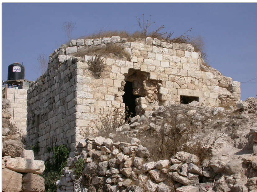
מבנה ב'גרעין הכפר'