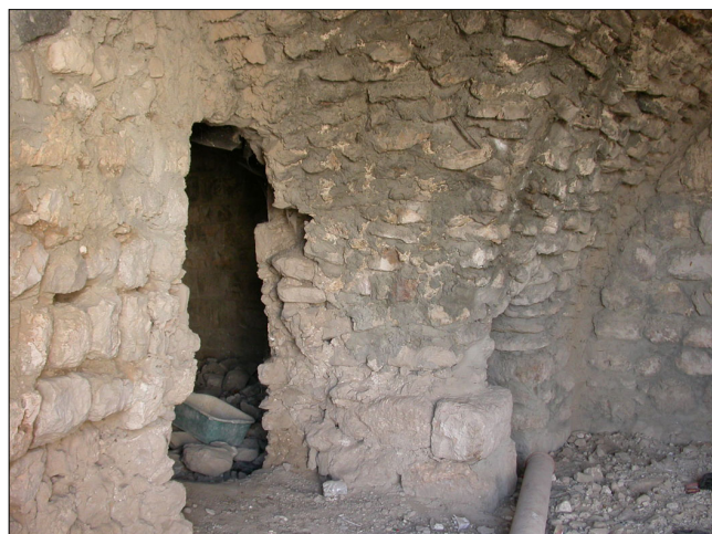
'גרעין הכפר', פנים מבנה