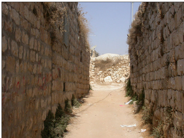
סמטה בין שרידי מבנים