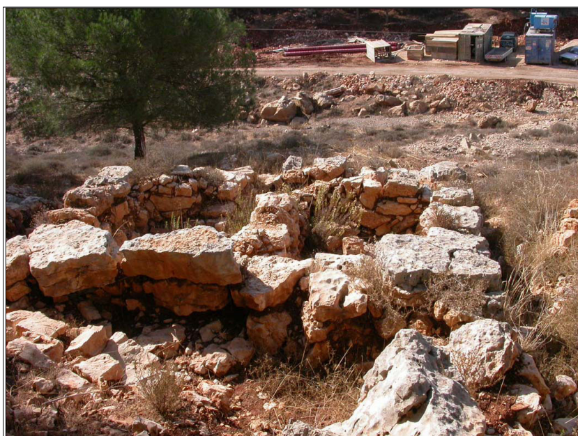
יער רמות, שרידי מבנה