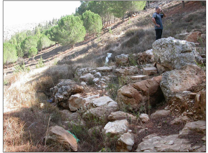
שרידי מבנה על מדרון הנחל