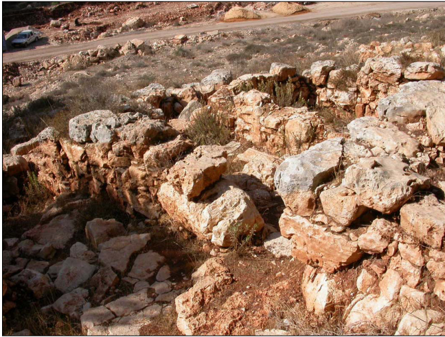
שרידי מבנה, סמוך לערוץ הנחל