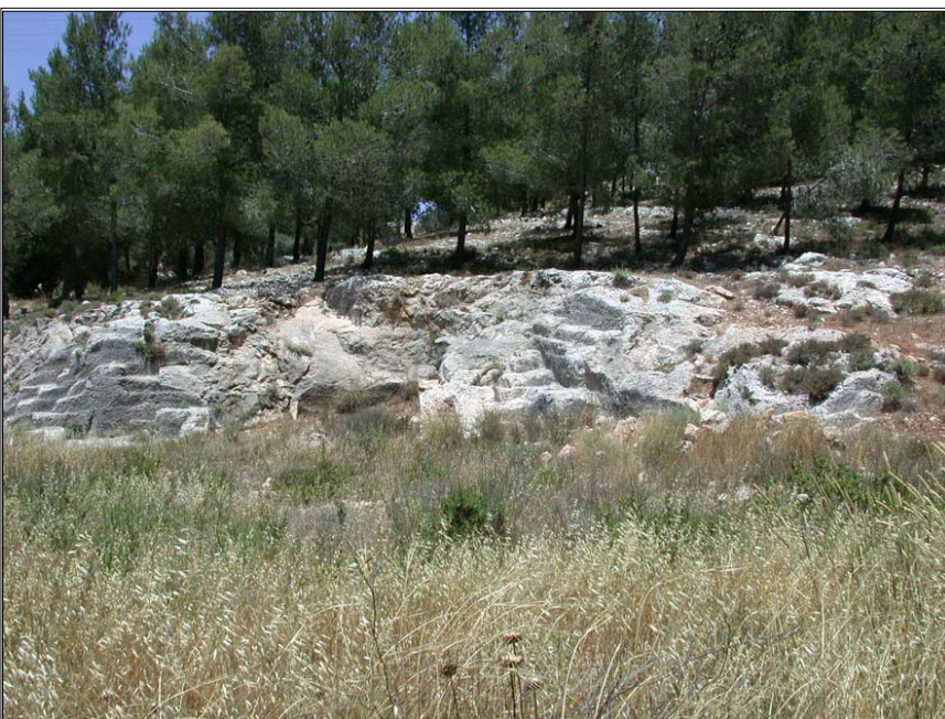
נחל צופים: מחצבה קדומה

שרידי מתקנים חקלאיים, מבנים, מערות קבורה ומחצבות עתיקות. לאורך תוואי הנחל אותרו שרידי דרך קדומה, חציבות במשטח הסלע, בורות מים וטראסות הרוסות למחצה, שרידי מבנה מלבני על המדרון הצפוני, חציבות דמויות אפסיס (קפלה?). בקרבת אפיק הנחל מצויות מדרגות עיבוד ורוגם (קוטר כ- 8 מ') כן נמצאו גתות, מערות טבעיות, קולומבריום חצוב במתאר דמוי צלב, במורדות שכונת רמות אשכול. [אתר אום אל עמיד (16) מצוי בתחום אתר זה]