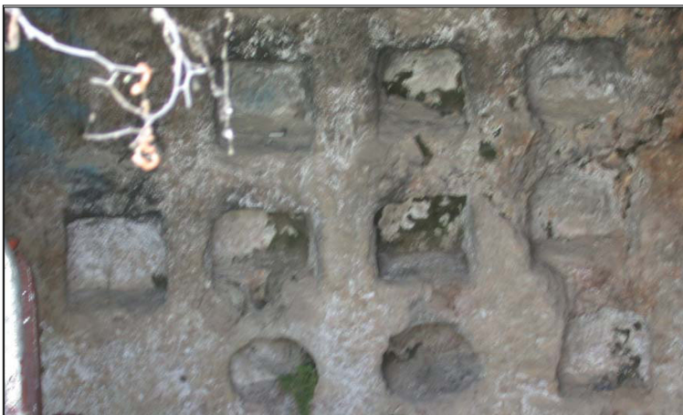
כוכים במערת קולומבריום.