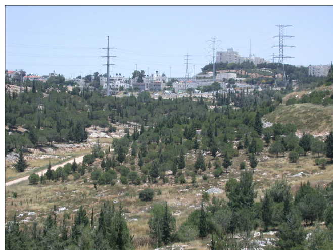
מבט לכיוון צפון