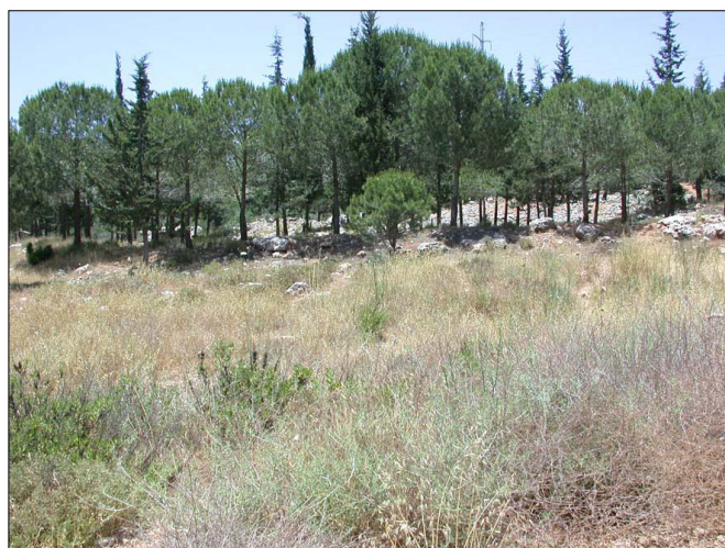
שרידי טראסות עתיקות