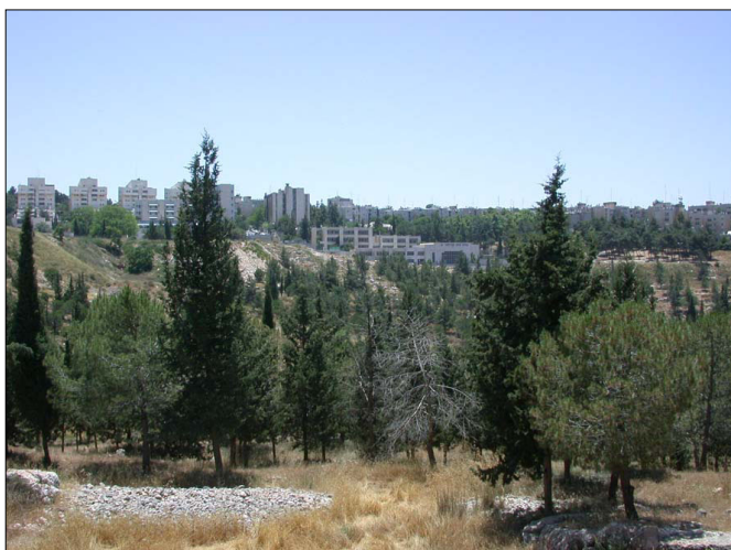
שרידי טראסות עתיקות