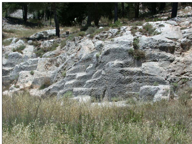
סימני חציבה בסלע