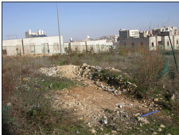
חלקו הצפון מערבי של האתר