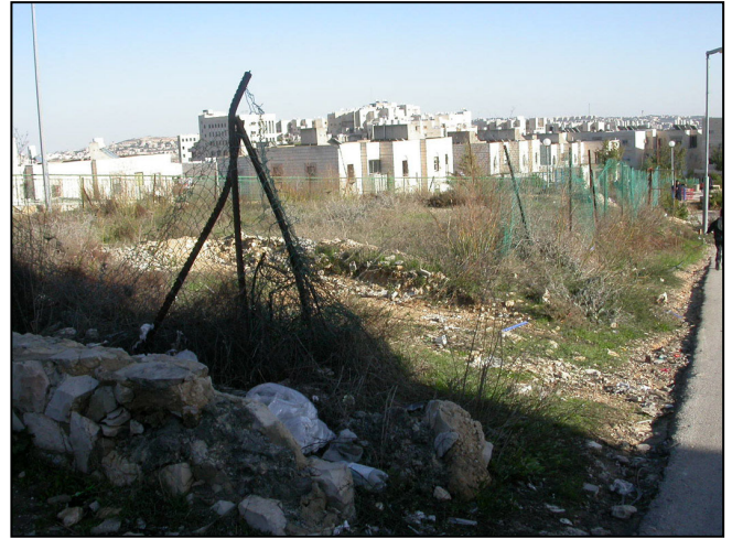
מבט מצפון מערב