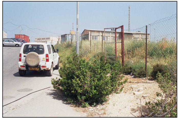
מבט מדרום מזרח