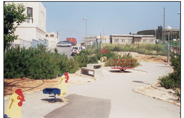
גן שעשועים בצד האתר