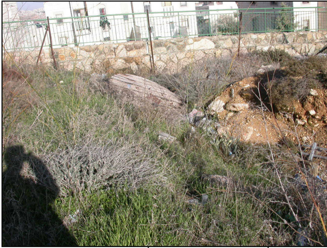
חלקו הדרום-מזרחי של האתר : אשפה