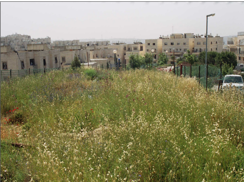
חר' אל כרום: המראה כיום

שרידי מבנה, ככל הנראה מנזר. מהמבנה שרדו שני החדרים בפינה הצפון מזרחית. הקיר הצפוני אורכו 18 מ', ואילו הקיר המזרחי נשתמר לאורך של 10.5 מ'. מרכז החדר הפינתי מוגדר ע"י עיטור צבעוני, הכולל שני מעגלים. עיטור בצבע שחור מחלק את החדר לארבעה אגפים. מעל העיטור הצבעוני מצויה כתובת הנתונה ב"טבולה אנסטה". הכתובת בת עשר שורות בשפה היוונית, ונזכרים בה אישים שונים בירושלים ביניהם תיאודורוס, פטריארך ירושלים במאה השמינית לסה"נ והמרטיר ג'ורג'.