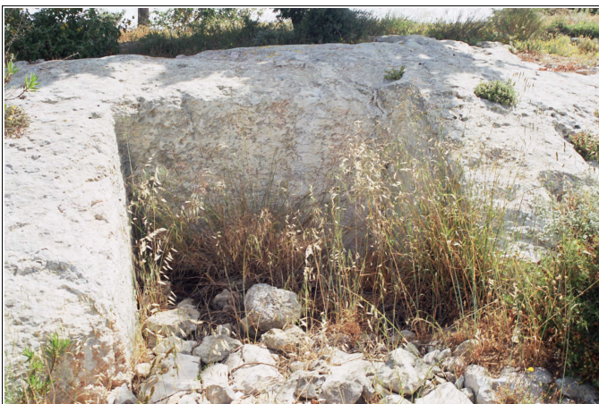
קברים מתקופת הברזל.