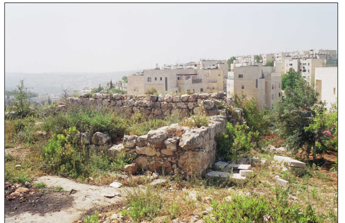
שרידי מבנים לאורך הרחוב הצלבני/ממלוכי