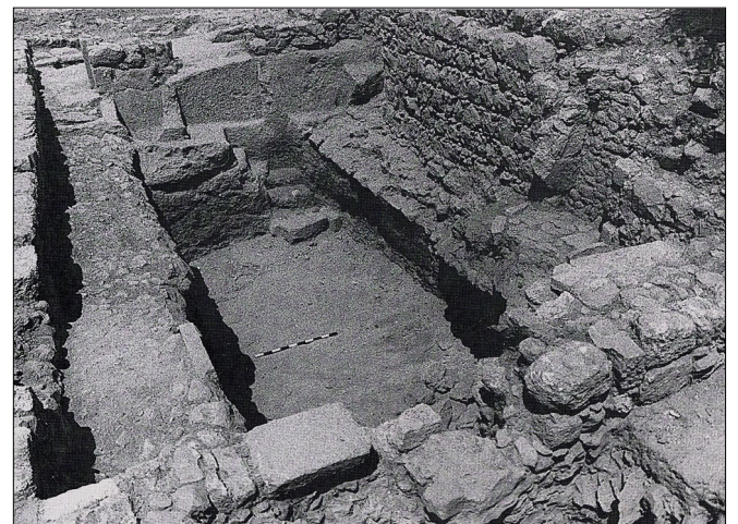
שרידי מבנה, מתוך: ח"א 101-102