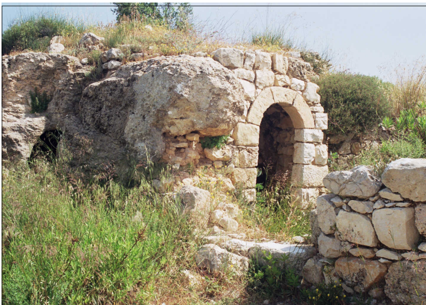
שרידי מבנה לאורך הרחוב הצלבני/ממלוכי

תקופות: ברונזה תיכונה 2, ברזל ב', פרסית, צלבנית, ממלוכית. רמת השתמרות: בינונית. ממצא מיוחד: בית יוצר ממלוכי. בכבשנים נתגלו מאות כלי קרמיקה בשלבים שונים של יצירה.