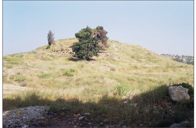
תל שטרס נחפר (ברונוה/ברזל) בראש התל שרידי מגדל מימי הביניים.