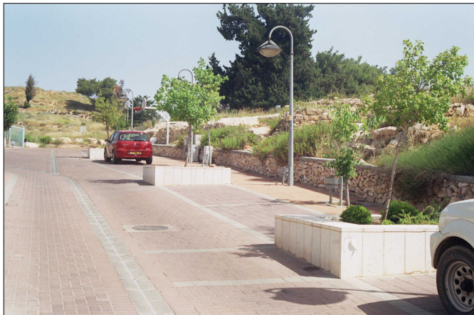
קיר הפרדה בין שטח האתר והרחוב הסמוך.