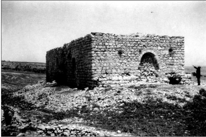
שרידי המגדל (נהרס 1967).