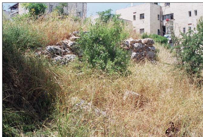
שרידי קיר המיצד