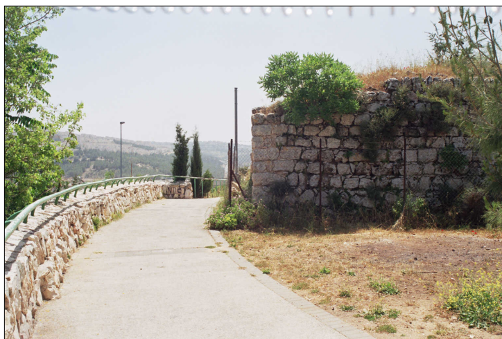
מבט מה"טיילת" המוגבהת