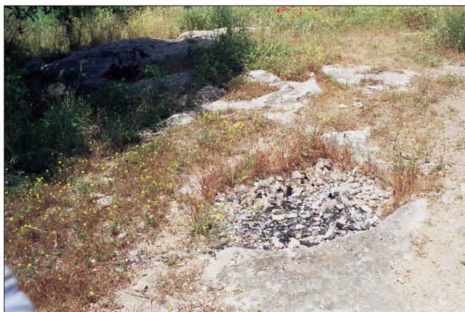
שרידי גת (סימני ונדאליזם)