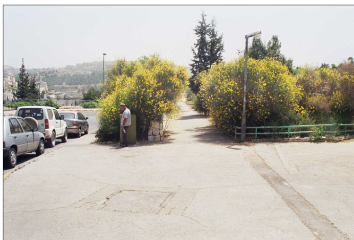
מבט מהרחוב הסמוך