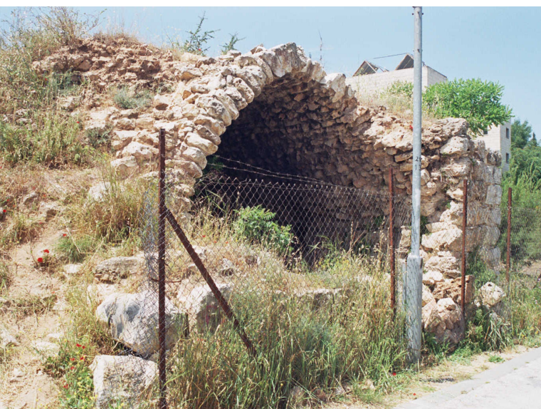
ח' בית כיכא

שרידי מבנה (מצד? בית חווה?) שמידותיו 9.5*9.5 מ', אליו צמוד מבנה מאוחר יותר בעל קמרון מחודד. קיר הבנוי על תשתית חצובה בסלע נמשך מן המבנה, ומתחתיו חצובה מערה. זמנו של המבנה: צלבני/ממלוכי. האתר חולש על דרך קדומה העוברת מצפון, בעמק נחל שורק. בסביבת המבנה פזורים בורות מים חצובים וטוחים, מתקנים חקלאיים ומערות קבורה שחלקן בעלות כוכים. (סקר ירושלים).