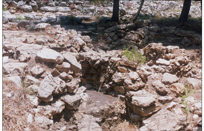
אתר מתקופת הברונזה התיכונה 22 ב'