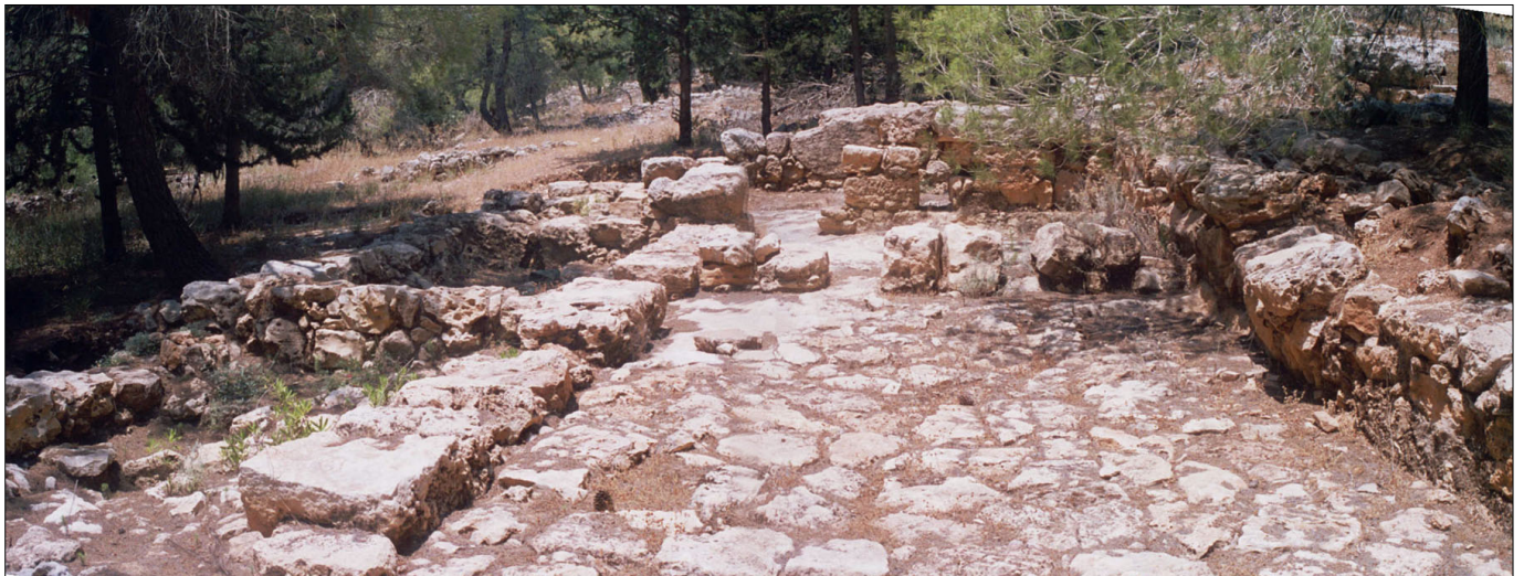
אתר מהתקופה הפרסית: מבנה 3 מרחבים.