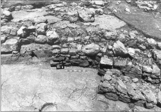
האתר בזמן החפירה