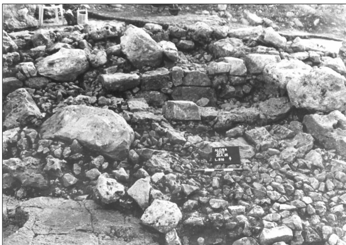
האתר בזמן החפירה