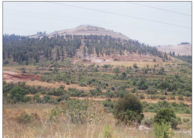
נוף לכיוון דרום, מדרך העפר הסמוכה ליער.