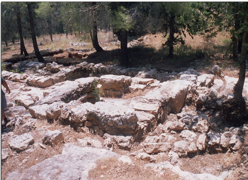
מבנה 3 מרחבים מהתקופה הפרסית.

במעלה המדרון נחשף מבנה מלבני (5.8*3.0 מ'). ע"פ מידות המבנה ותכניתו, נראה כי מדובר בשומרה מתקופת הברזל או מהתקופה הפרסית. (ע"פ וקסלר-בדולח ש').