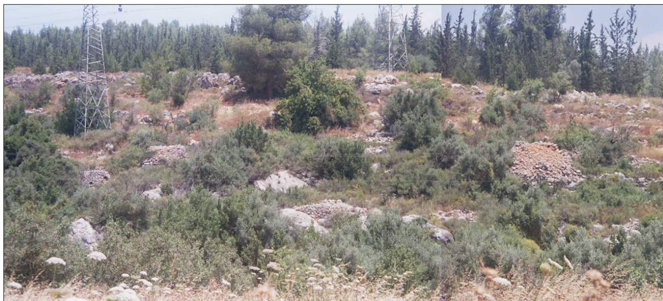
מדרגות חקלאיות ושרידי שומרות