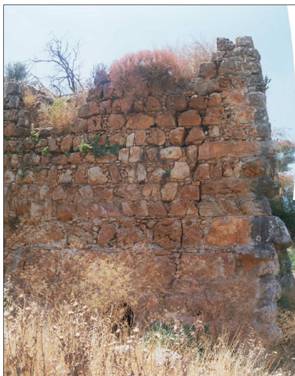
שרידי מבנה מהתקופה הצלבנית.