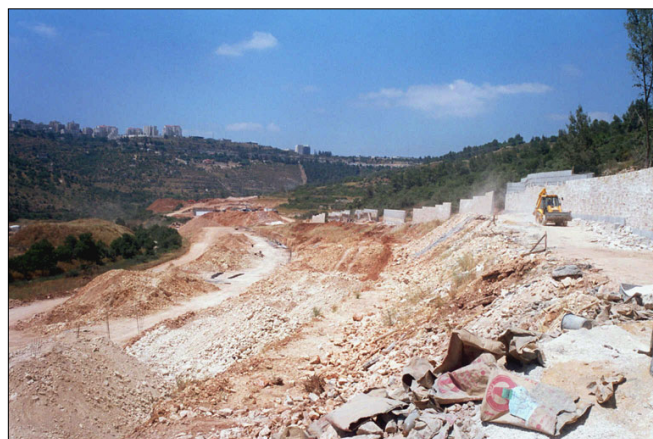
סלילת כביש מס. 9 בערוץ העמק.