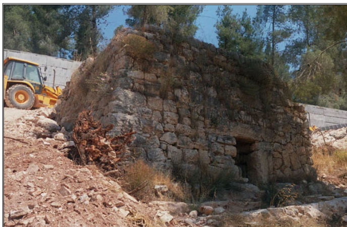
שומרה (פורקה בשנת 2003)