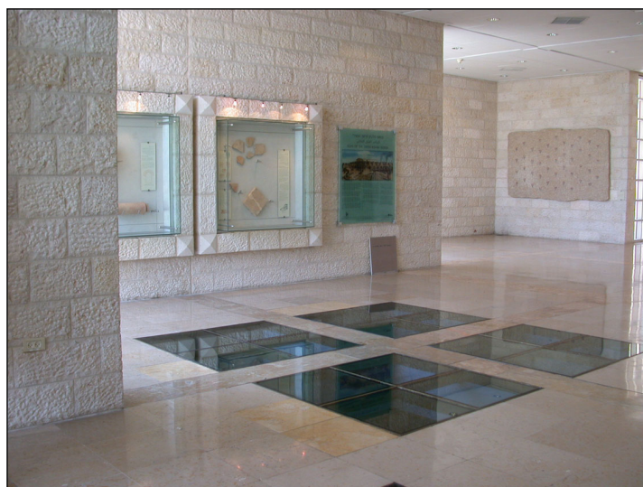
מבואת אולם טדי - תצוגת ממצאים.