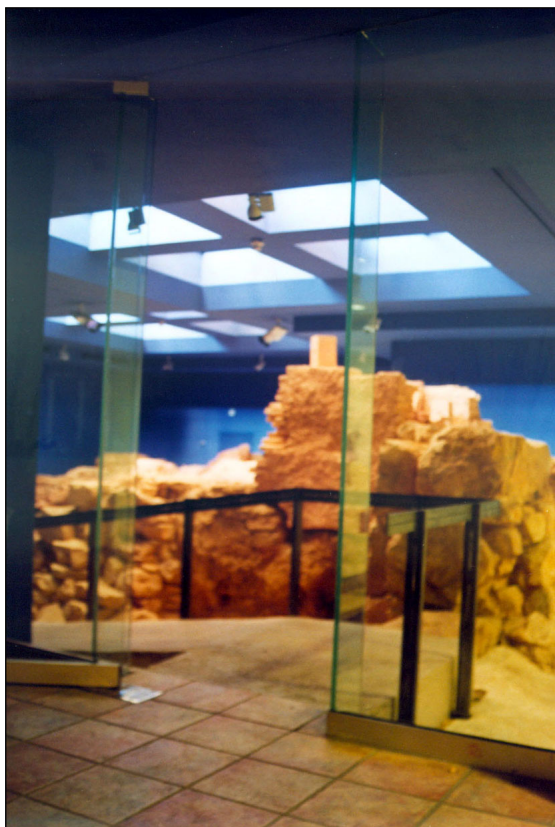
הכניסה לאתר המשוחזר.