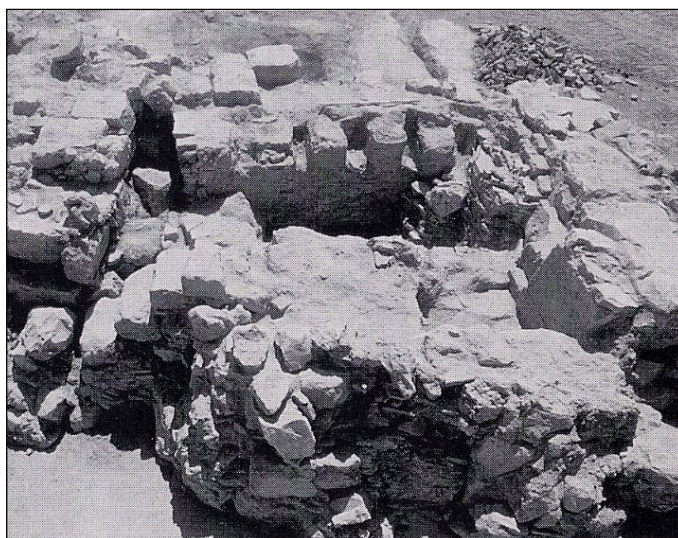
הכבשנים באתרם