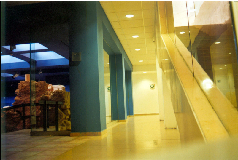
שרידי בית היוצר (משולבים כיום במבנה המודרני)

באתר נחשפו שרידים נוספים אך אלו פורקו/כוסו במסגרת הבנייה המודרנית: שרידי מנזר, שנתגלה ע"י מ' אבי יונה בשנת 1949, שרידי קסרקטין או מצד רומי (בספק), מערכת מים שכללה בריכת אגירה, בורות מים ותעלות הזנה, וכן בתי בד ומכלול קבורה.