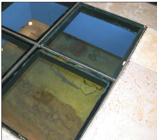
רצפה שקופה - תצפית על האתר.