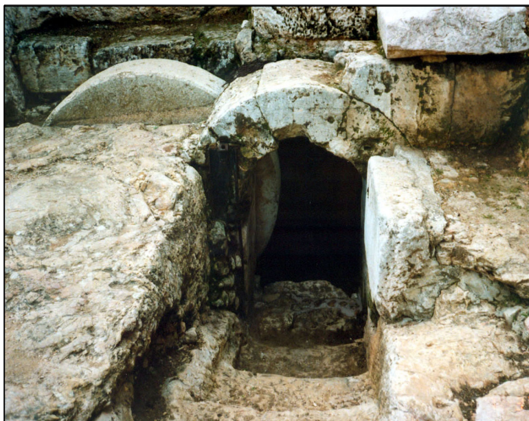
פתח מערת הקבורה, אבן הגולל.

מערת קבורה במדרון, חלקה חצוב בסלע וחלקה בנוי, המיוחסת לתקופה ההרודיאנית. בחזית המערה חצר ובקדמת המערה מבנה 'נפש' הבנוי בבניית גזית, ממנו שרד נדבך אחד. במערה חדר מרכזי וארבעה חדרי קבורה המסודרים סביבו בצורת צלב. דפנות חדרי הקבורה כוסו בלוחות אבן גיר שיצרו פנים חלקים ומפוארים. הכניסה לחדר מכיוון צפון, ונעילת הפתח נעשתה באבן גולל עגולה. בחדר הדרומי נמצאו שני סרקופגים ושני מכסים. (ע"פ סקר ירושלים). בסמוך, מדרום מזרח, מערת קבורה נוספת. בקדמת המערה אולם מבוא, שמסילה חצובה לאבן גולל בפתחו. במערה חדר מרכזי ושלושה חדרי קבורה. מדרום מערב נחשפה מערה נוספת. פתח המערה פונה למזרח. המערה בת חדר אחד שחמישה כוכים נחצבו בדפנותיו ובור עמידה נחצב בקרקעיתו. מסורת מזהה מערה זו כקבר משפחת הורדוס.