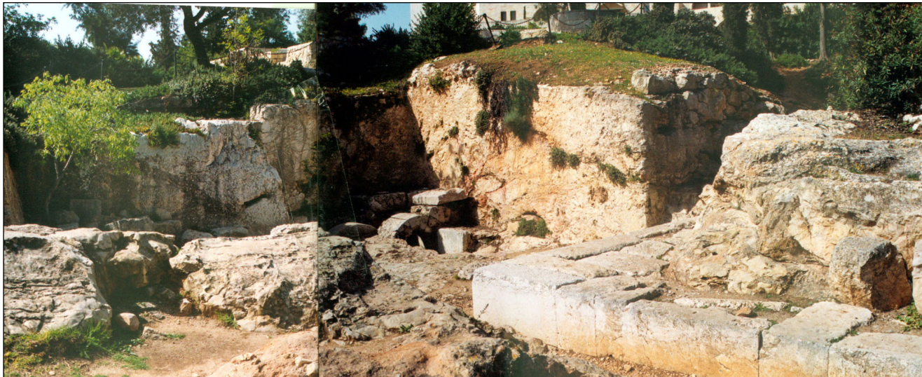
שרידי אולם מבוא בקדמת מערת הורדוס