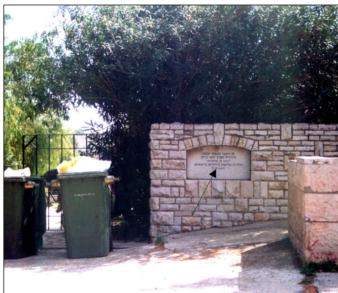
שילוט בכניסה הצפון מערבית לגן