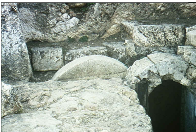
פתח מערת הקבורה, גולל.