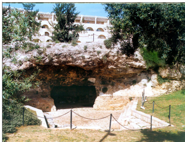
מערת קבורה משולבת בגן.