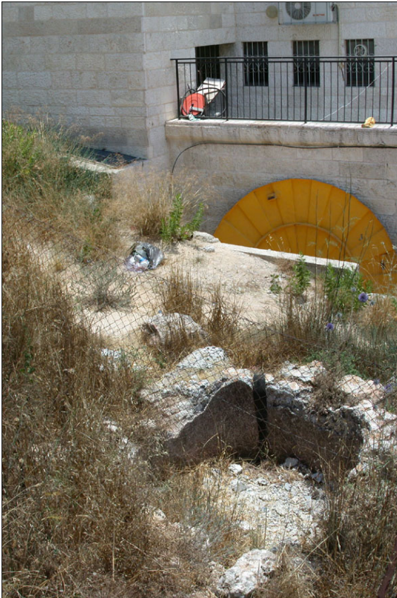
שרידים נוספים בשולי האתר.