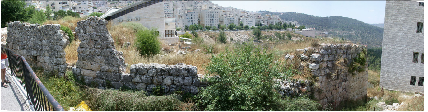
שרידי המבנה - מבט פנוראמי.