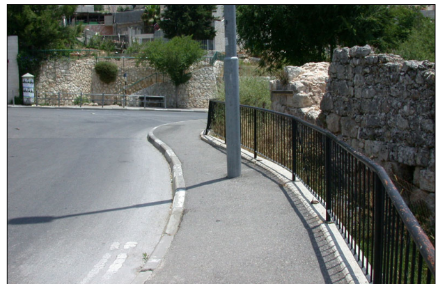
שרידי המבנה - סמוך לרחוב מגורים.