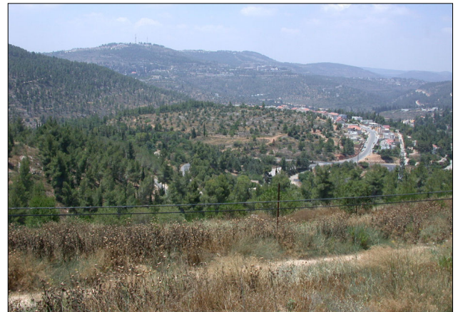
נוף מהאתר - מבט לכיוון מערב