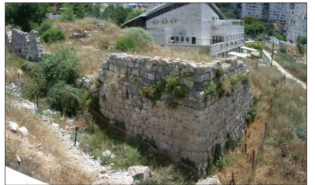
שרידי המבנה - מבט מכיוון צפון מערב.