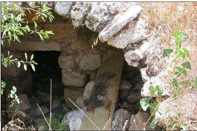
כניסה למפלס החדרים המקומרים