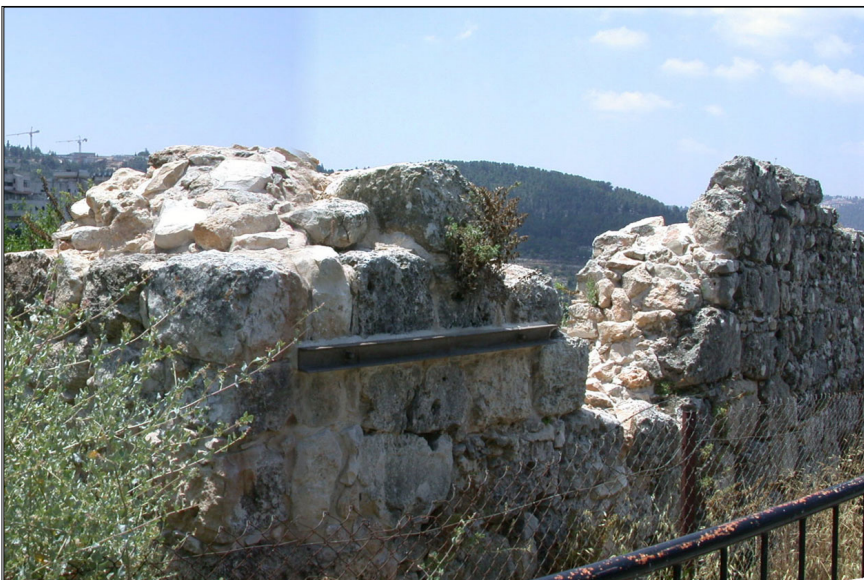
ח' עין תות

שרידי מבנה מבוצר (17*30 מ') ככל הנראה בן שלוש קומות: קומת מרתף ושתי קומות בנויות. החדרים קורו בעזרת קמרונות. ניתן להבחין במספר שלבי בנייה מן התקופה הצלבנית, במהלכה שימש המבנה כבית חווה מבוצר. בשלב הראשון של המבנה הותקנה בו מערכת ניכוז הכוללת בור מים, שתי בריכות ומערכת צינורות. מצפון למצודה נמצאו שרידים של מבנה בנוי גזית שנבנה על שרידיה של מערה חצובה. במערה נמצאו מספר ממצאים מהתקופה ההרודיאנית. בקרבת מקום אותרו בור מים, שוקת ושתי גתות חצובות בסלע. גת אחת נחצבה במרחק של כ- 20 מ' מצפון מזרח לשרידי המבנה. מרכיביה של הגת: משטח דריכה מרכזי, שבמרכזו נקבעה אבן רבועה שנחצב בה חור מפולש, ומשטח דריכה נוסף מצפון. הגת השניה אותרה במרחק של כ- 80 מ' ממערב לגת הראשונה. הגת כוללת משטח דריכה ובור היקוות.