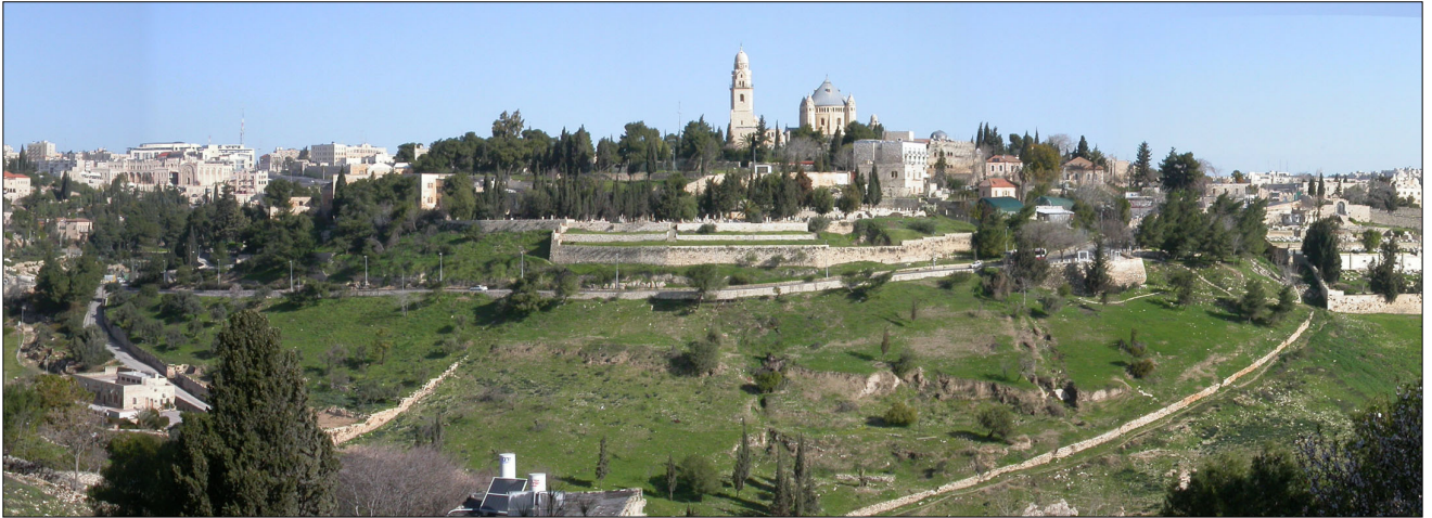
מראה כללי: מבט מדרום