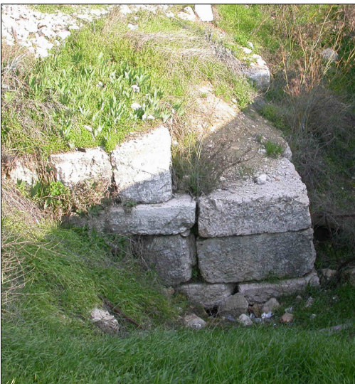
שרידי חומה, סמוך לביה"ק הפרוטסטנטי