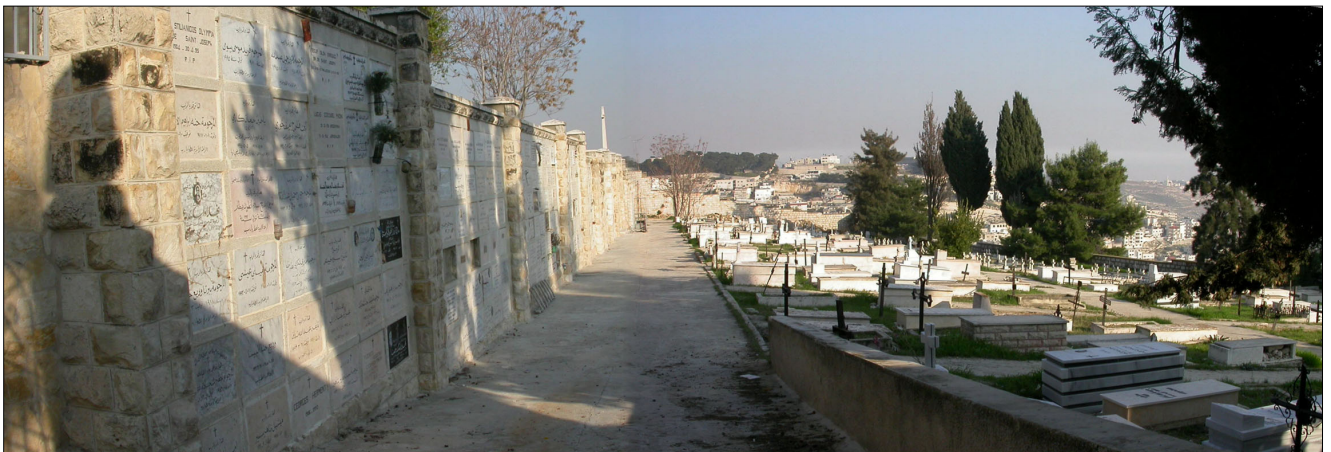
המדרון הדרומי: בית קברות