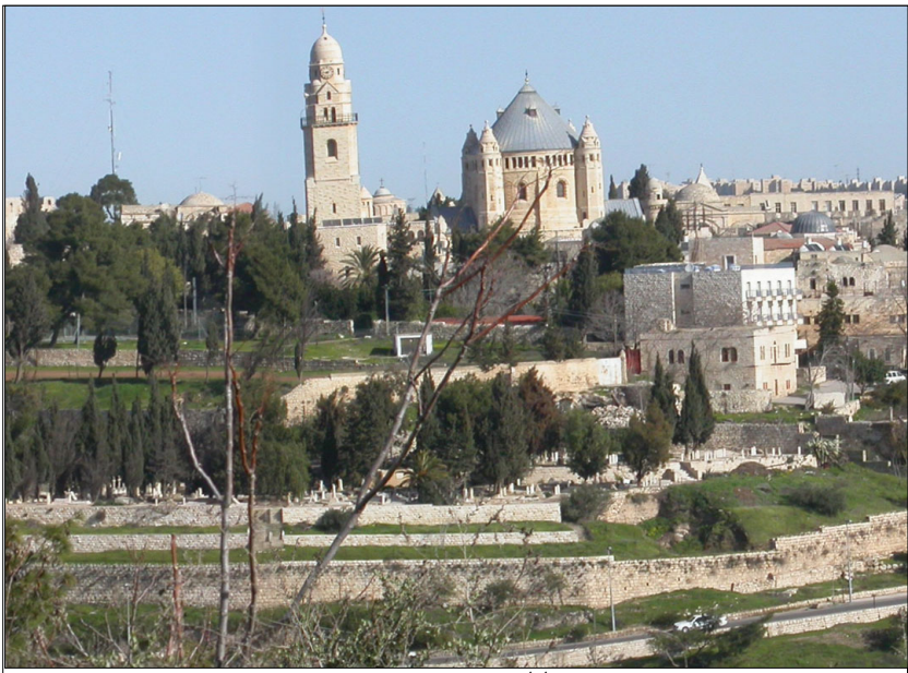
מראה כללי, הדורמציון וטראסות

תאור הממצאים: "הר ציון" כולל, מן הבחינה הגיאוגרפית, את הרובע ההרודיאני, חלק מהרובע היהודי, והשטח שמדרום מערב לעיר העתיקה. בסוף ימי בית ראשון, נכלל ההר כולו בתחומי ירושלים, כך גם בימי החשמונאים, בימי בית שני ובתקופה הביזאנטית. בסוף ימי בית ראשון נקרא ההר "המשנה" ובימי בית שני – "העיר העליונה". השם "הר ציון" מקורו בתקופה הביזאנטית. ההר הוצא מגבולות י-ם רק במאה ה-11 בעת שיקום חומות העיר שנפגעו ברעידת אדמה. כנסיית ציון הקדושה והדורמציון: שרידי כנסייה שנבנתה בשנת 390 לסה"נ על המקום בו, ע"פ המסורת הנוצרית, נערכה הסעודה האחרונה, כנסייה זו היא מהקדומות ביותר ומזוהה גם עם מקום תרדמתה של מרים אם ישו. הכנסייה חרבה בפלישה הפרסית, ושוב ע"י הערבים בשנת 996. הצלבנים הקימו במקום כנסייה חדשה בשם "גבירתנו של הר ציון" הכנסייה הנוכחית הוקמה בשנת 1900. שרידים מהכנסייה העתיקה משולבים בחדשה. חדר הסעודה האחרונה, וקבר דוד: ראה אתר מס' 60. "החומה הראשונה": באזור ביי"ס גובאט, וכן באזור ביה"ק הפרוטסטנטי, נחשפו שרידים של החומה מתקופת בית שני. ראה גם אתר מס' 61. מערות קבורה: בהר ציון נחשפו מערות קבורה מתקופות שונות.