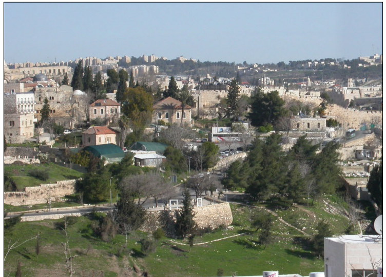
מראה כללי: מורדות מזרחיים