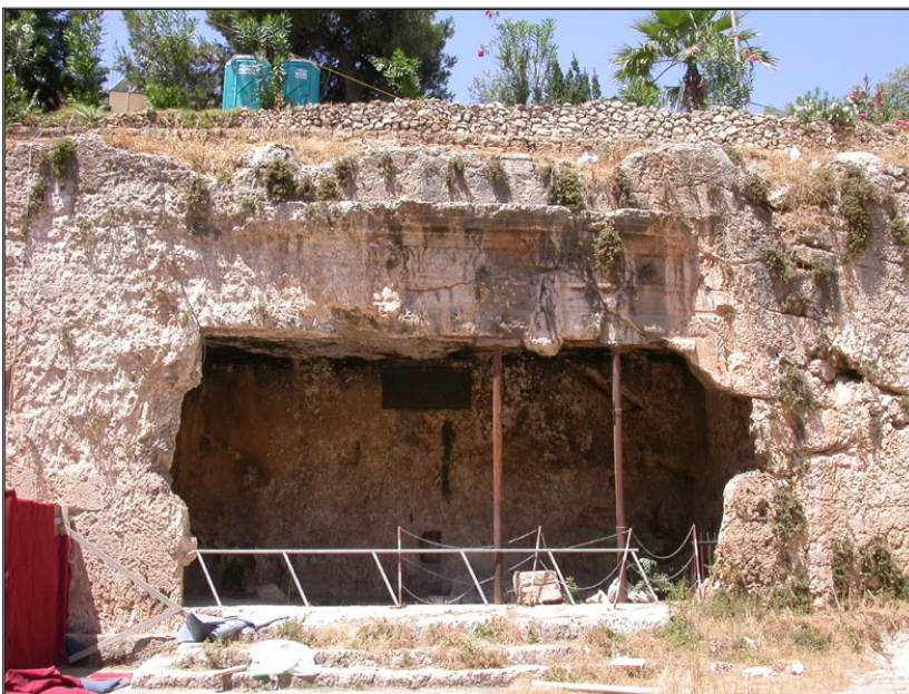
חזית מערכת הקבורה

מערכת קבורה מהגדולות והמפוארות בירושלים. גרם מדרגות רחב מוליך אל חצר שבתחתיתה שני בורות מים שניקזו אליהם את אזור הכניסה למתחם והמדרגות. בורות אלו שמשו גם כמקוואות טהרה. מחצר זו מעבר לחצר גדולה (27.4 * 25.7 לערך) חצובה בסלע. בחזית המערבית של החצר חצובה החזית המפוארת של הקבר, המעוטרת במקלעת עלים ומעליה אפריז דורי שבמרכזו אשכול ענבים. סביב החצר הותקן ספסל. פיתחה של המערכת נסגר בעזרת אבן גולל עגולה. במערכת שמונה חדרים: חדר מרכזי, שלושה חדרי קבורה, שלושה חדרים קטנים וחדר עם אצטבות סביב. במערה ארבעים ושבעה מקומות קבורה לקבורה ראשונית ואצטבות ארקוסוליה. המערכת מזוהה כמקום קבורתם של משפחת הלני מחדייב. לפי תאורו של יוסף בן מתתיהו ניצבו שלוש פירמידות על חזית הקבר (קדמוניות כ"ד ג').