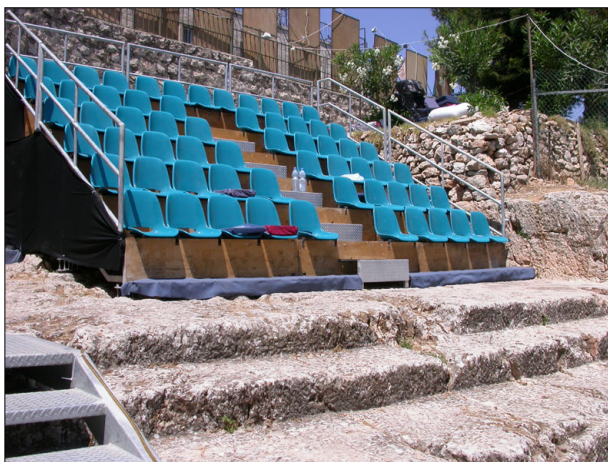
שימוש במדרגות ובחצר הקטנה לארועי תרבות