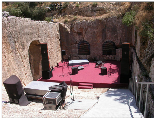
החצר ה"קטנה", בורות מים