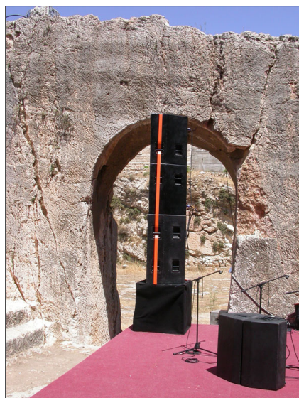
מעבר חצוב בין החצרות