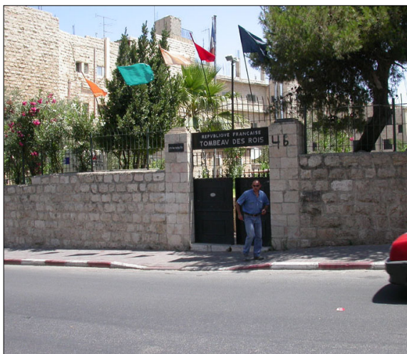
שער המתחם כולו (רח' סלאח א דין)