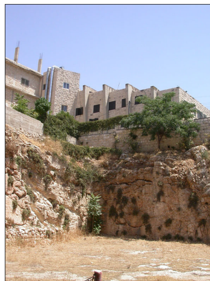
החצר הגדולה, פינה צפון מזרחית