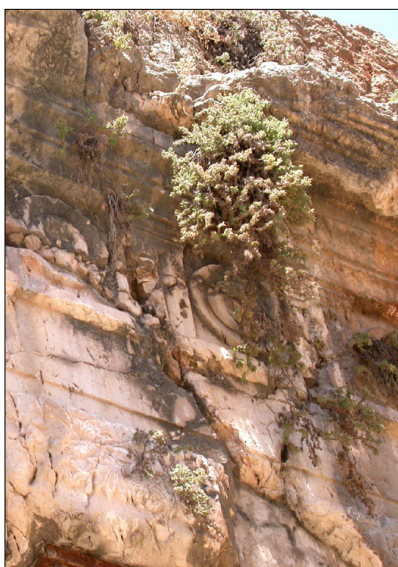
עיטור בחזית המערכת