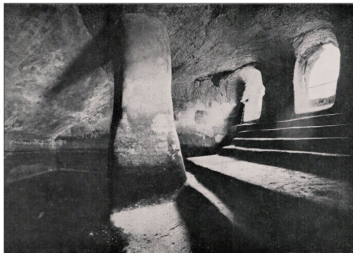
בריכה "B", מתוך: מ. כהן, "קברי המלכים"