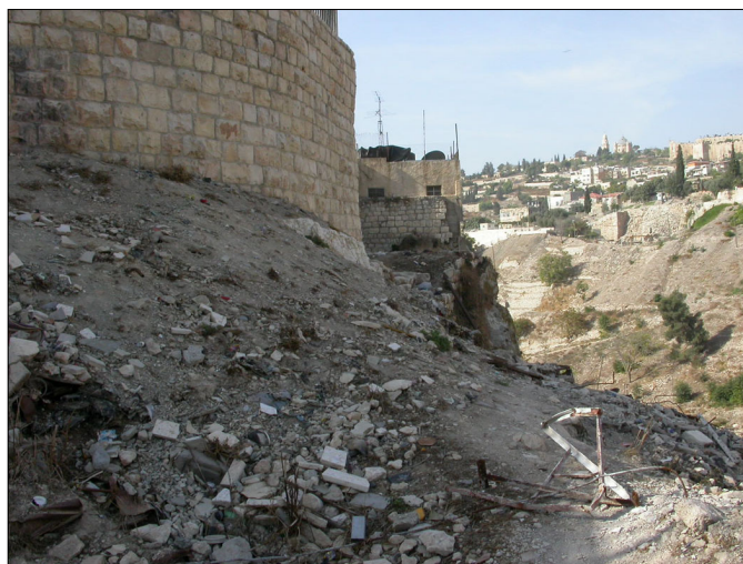
המדרון ליד כפר השילוח