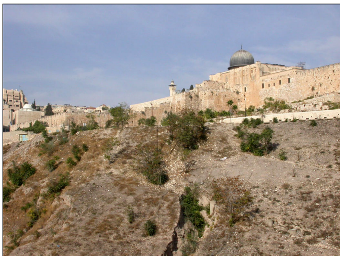
מבט מערבה: מדרון הקדרון והר הבית