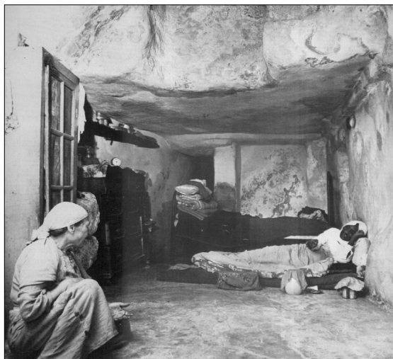
מגורים באחת המערות, שנות ה-80 של המאה ה-20, מתוך: "כפר השילוח", דוד אושיסקין