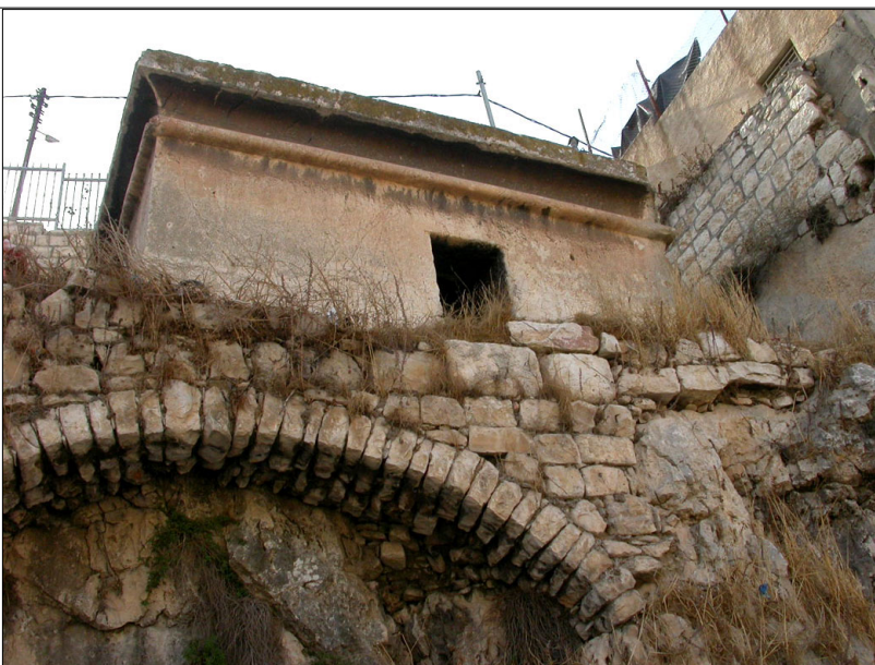
קבר בת פרעה, כפר השילוח

חלק ממערות הקבורה שימשו למגורי נזירים מתבודדים בתקופה הביזאנטית.