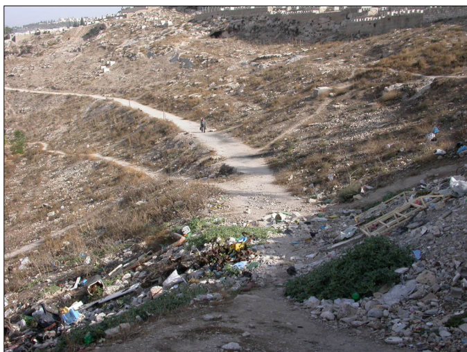
דרך העפר מהמונומנטים בנחל קדרון לכפר השילוח