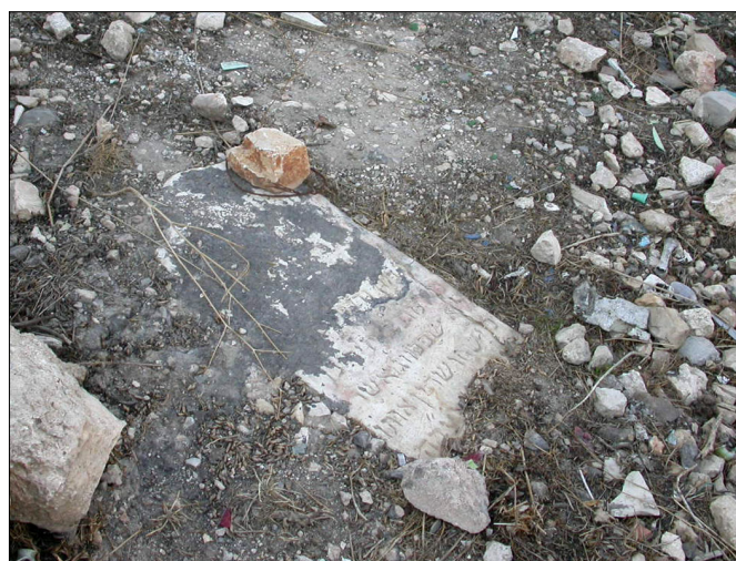
מצבות בשביל המוזנח בדרך לכפר השילוח