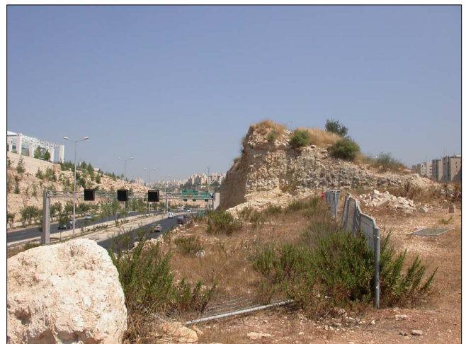
הקשר סביבתי : כביש מס. 4