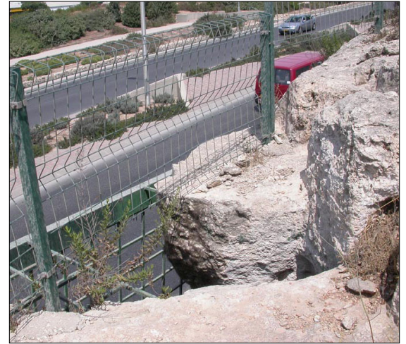
ההקשר הסביבתי: דרך ברעם