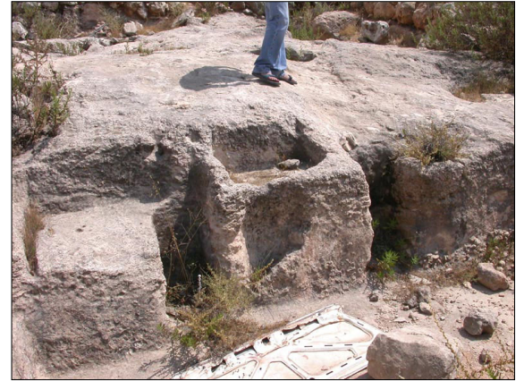
שקעים לעיגון קורות