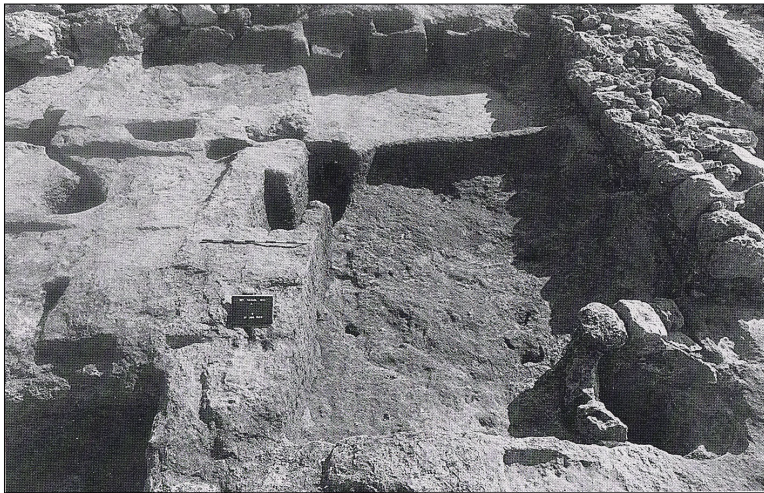
מראה בסיום החפירה. מתוך: ח"א 101-102