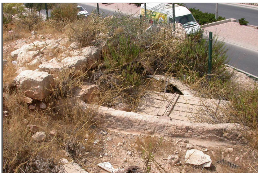
בית צפפא, גת (ברקע: דרך משה ברעם)