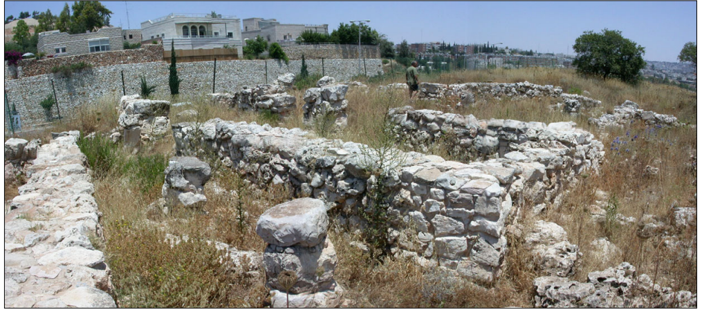
מבט מכיוון דרום מזרח