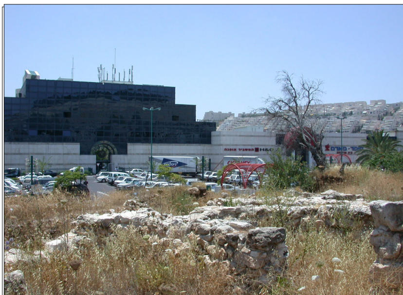
אתר מנחת (ברקע: קניון מלחה)

שרידי ישוב פרזות מתקופת הברונזה התיכונה אי-ב'. הישוב כולל מבנה ציבורי (פולחני?) שבחלקו המערבי נתגלו שתי מצבות פולחניות וספסל להנחת מנחות. ממערב למבנה הפולחני: בית חצר טיפוסי הכולל מערכת חדרים המקיפה חצר מרכזית אשר בתוכה נתגלו מספר מתקני בישול ואפיה. במרכז, נחשף בור שניכרים בו סימני חציבה, ובחלקו העליון נקברה כבשה מעוברת. לפני החפירה, בלט בשטח זה מעל פני הקרקע רוגם אבנים, כנראה ערימת סיכול. במילוי נמצא קמיע פאנייס בדמות בס, וכן ידית קנקן נושאת טביעה בדגם וורדה. מתקופת הברזל נחשפו באתר שרידי טראסות חקלאיות.