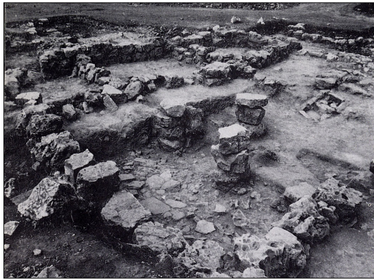
מבנה 1028. מתוך: קדמוניות 103-104