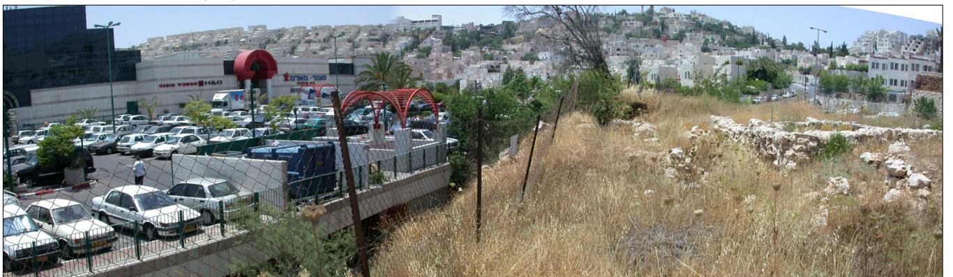
האתר וקרבתו לקניון