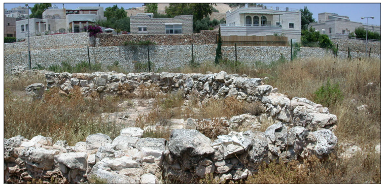
מבט מכיוון מזרח