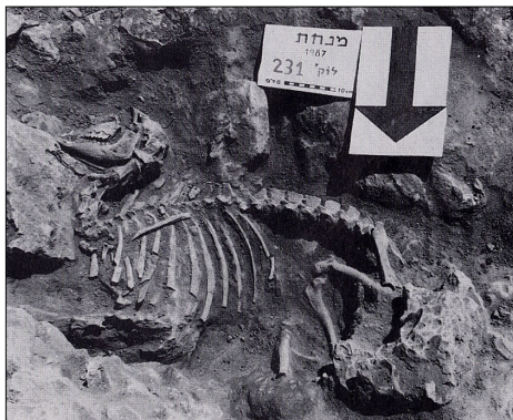
קבורת כבש בחצר מבנה 215. מתוך: קדמוניות 103-104