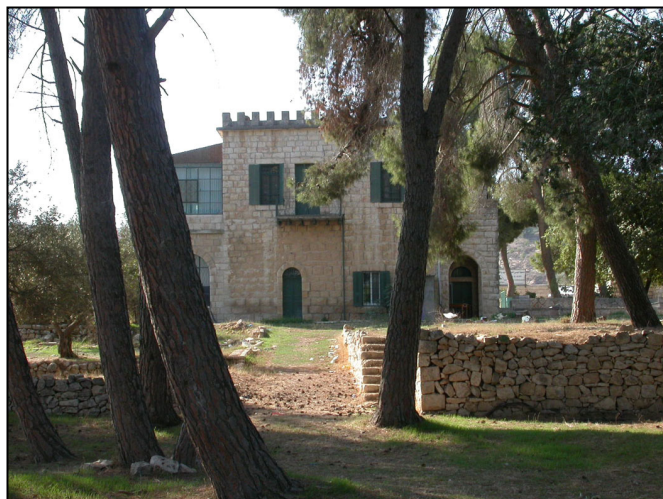
בית אל עלמי