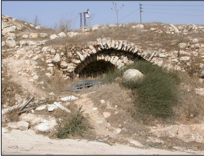
קמרונות, גרעין הכפר