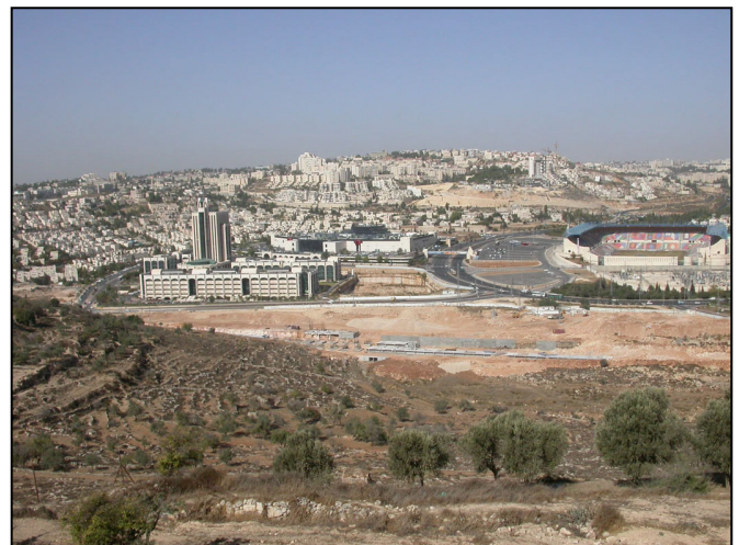
מראה הנוף מגרעין הכפר