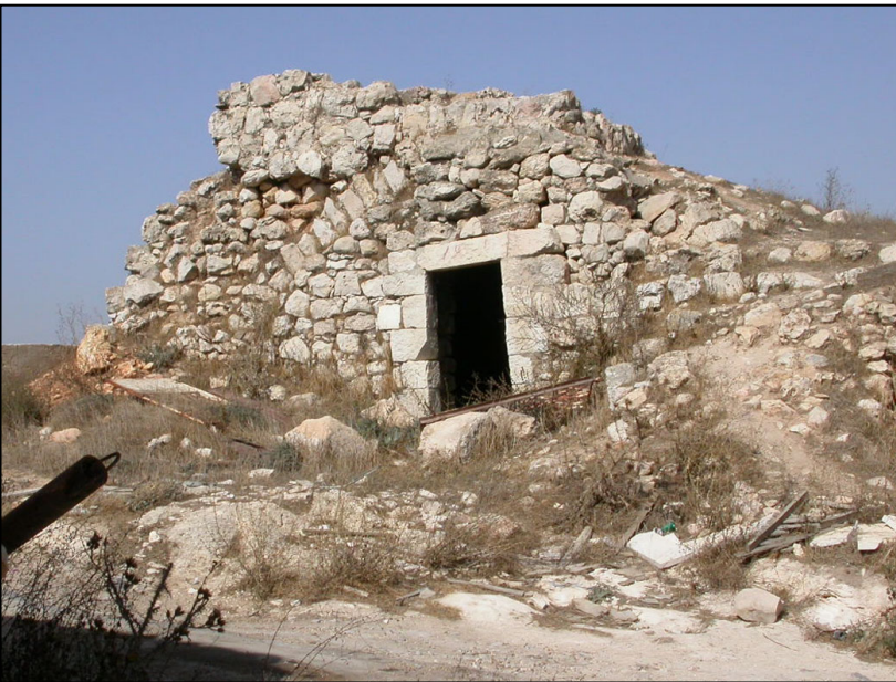
גרעין הכפר, מבנה עות'מאני (?)

1. מקווה טהרה, בורות מים, מערת קולומבריום ומתקנים חצובים נוספים: המקווה נחצב במעבה הסלע. לפני חדר הטבילה נחצב מסדרון מבוא והותקנו בו מדרגות. בחלקו העליון של המסדרון נחצב אגן מלבני קטן (שימוש משני?). בתחתית גרם המדרגות מצוי קיר החזית של חדר הטבילה ששני פתחים קשתיים נחצבו בו ואומנה מלבנית מפרידה ביניהם. קיר החזית החיצוני גבוה בכ- 0.8 מ' מעל ראשי הפתחים הנ"ל, ותקרת חדר הטבילה נמצאת במפלס זהה לראשי הפתחים. 2. גרעין הכפר העתיק: בתי אבן וקמרונות ששרדו, בפסגת הכפר. רוב המבנים הם מהתקופה העות'מאנית אולם יתכן ונבנו על גבי יסודות קדומים יותר.