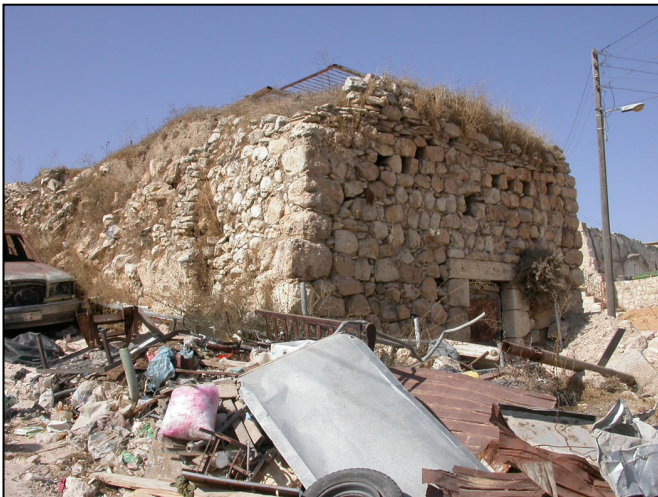
שרידי מבנה, הזנחה.