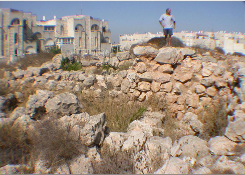
שרידי המגדל הרבוע

תאור הממצאים: שרידי ישוב מתקופת הברזל א' (התנחלות שבטי ישראל). מדרום: בית מגורים בעל חצר קדמית וחצר פנימית הנחלקת ע"י ארבע אמנות אבן - דוגמא קדומה של הבית בעל ארבעת המרחבים. מצפון מזרח: שרידי יסודותיה של חומה (1.5 מ' עובי), מגדל רבוע ושרידי בניה מן התקופה הביזנטית/ערבית קדומה. יש שזיהו את האתר עם 'בעל פרצים' (שמואל ב' ה' כ'), שם הכה דוד את הפלישתים.