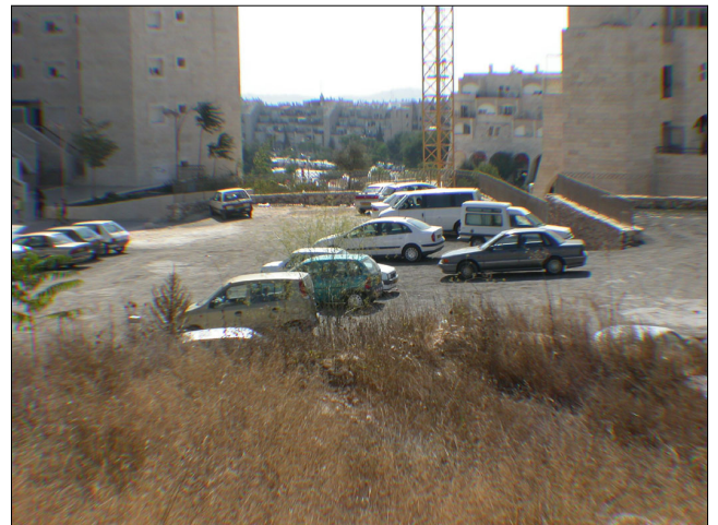
מגרש חנייה, דרומית לאתר.