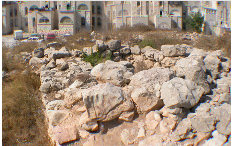
מבני מגורים סמוך לאתר.