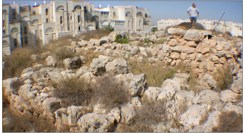
שרידי מגדל (מסומן בחץ).