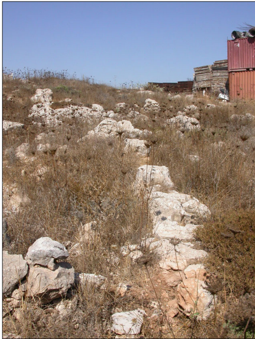
שרידי קירות, צמחייה גבוהה.