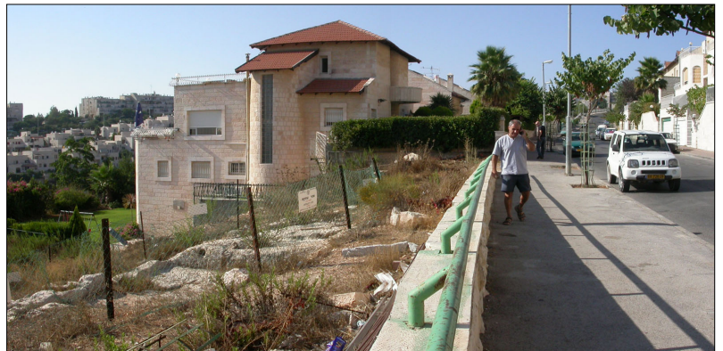
סביבת האתר, מבט לדרום.