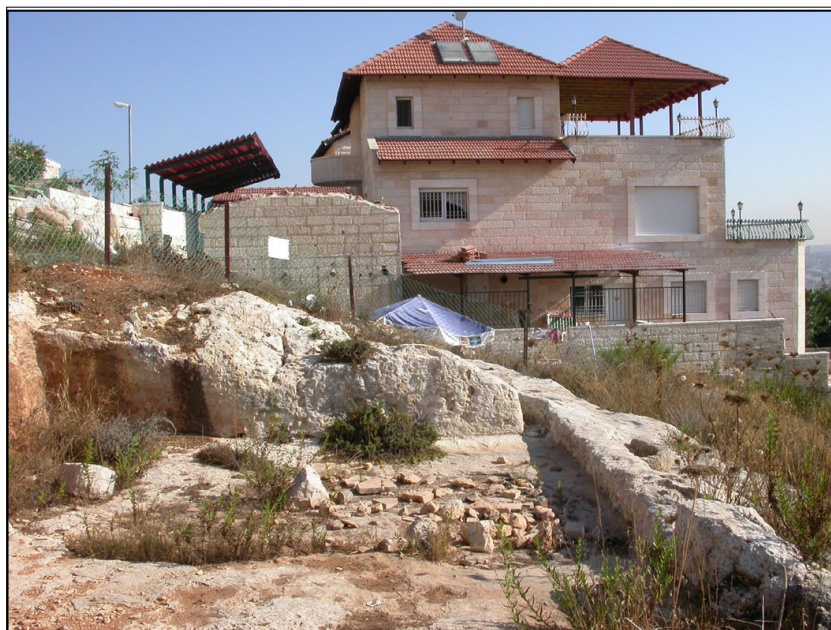
גת (מבט צפונה)

גת החצובה בסלע. הגת כוללת: משטח דריכה גדול (5*6.5 מ'), בור שיקוע (1*0.85 מ') ובור היקוות (1.3*0.6 מ'). בבור ההיקוות נחצב פתח המוליך אל בור מים. על דפנות הבור שכבה עבה של טיח גס. (סקר ירושלים [105] אתר 134)