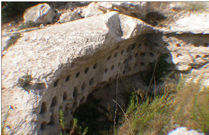
גומחות חצובות הנראות מבעד לתקרה ההרוסה.