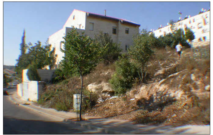
סביבת האתר, מבט לדרום.