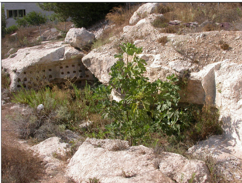
גילה, מערת קולומבריום: מבט לדרום מערב.

מערת קולומבריום החצובה בסלע. תקרת המערה התמוטטה. בדפנות המערה נחצבו גומחות רבועות ועגולות למחצה. סמוך למערה מצפון: מערת קבורה שהוסבה לשמש כמאגר מים. בקרבת המערה גת קטנה בעלת משטח דריכה ושני בורות היקוות.