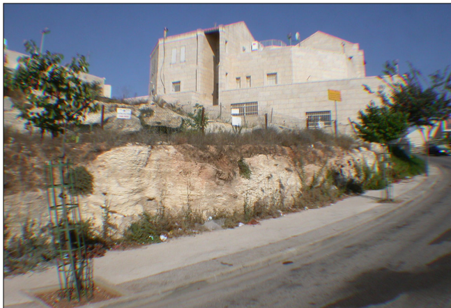
סביבת האתר, מבט לצפון.