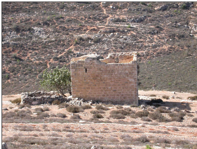
שומרה, נחל גילה

תקופות: הרודיאנית, רומית, ימה"ב, עות'מאנית