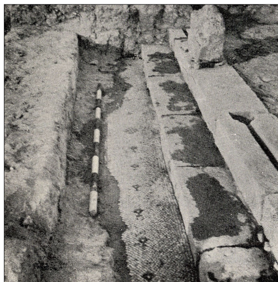
שרידי מבנה הכנסייה (לא נראים כיום).