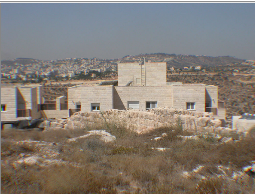
מבט מהאתר (בקדמת התמונה)

שרידי מנזר (24.7*18.4 מ') וכנסייה מהתקופה הביזאנטית. במרכז המכלול נבנתה חצר, החדרים מוקמו בצידו המערבי של המכלול וכנסייה נבנתה בחלקו הצפוני. באחד החדרים נחשפה רצפת פסיפס לבנה. בחצר נחצב בור מים מעוגל בעומק של כ-4 מ', דפנות הבור טוחים בטיח על בסיס סיד. סמוך לבור - אגן קטן עם תאים מלבניים. מחוץ למכלול המנזר נחצבה שוקת מלבנית. בכנסייה, בחלקו הצפוני של המכלול, נחשף אפסיס הפונה מזרחה (קוטר: 2.25 מ'). בתקופה המוסלמית חולק מבנה הכנסייה לשלושה חלקים. כן נחשפו בכנסייה שרידי ה"אלתרי", עם שתי מדרגות המקשרות בינו לבין חלל הכנסייה. האפסיס בנוי בסלע האם, פעולה שהצריכה חציבה לעומק של כ-4.7 מ'. קורבו מזהה באתר את מנזר פונטינוס-מרינוס שנוסד במאה ה-5 לסה"נ ע"י תלמידיו של אבתימיוס הקדוש. בסמוך: שרידי מבנים עות'מאניים וכן חומה מאוחרת. בחלקה הדרומי של השכונה נחשפה גת.