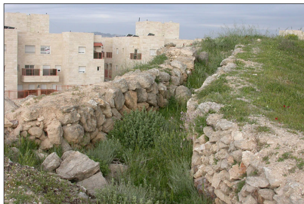
שרידי תעלות מגן ירדניות