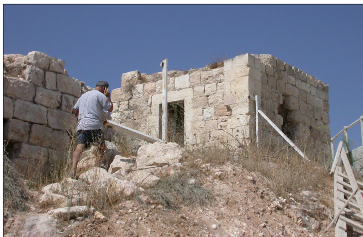
שרידי מבנה עות'מני (?).