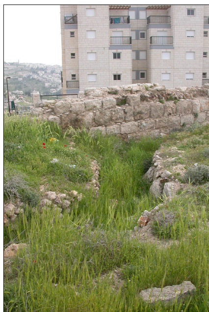
ההקשר הסביבתי : שטח פתוח, בלב שכונת מגורים.