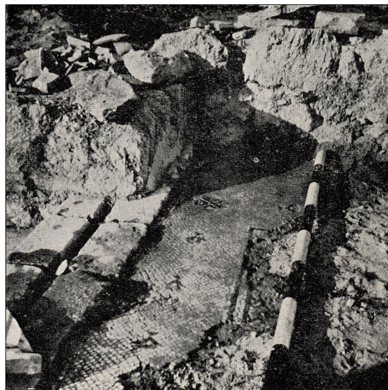
שרידי מבנה הכנסייה (לא נראים כיום).