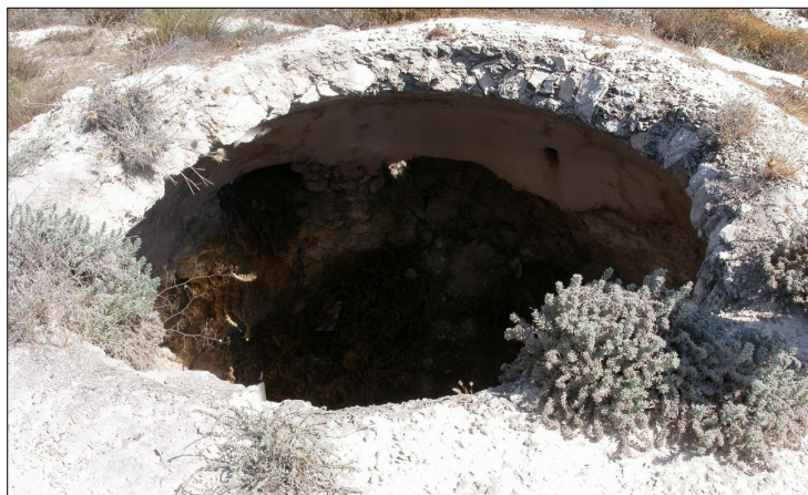
שרידי בור המים