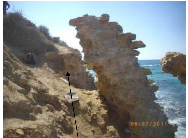
כאן אפשר לראות את קו הפן המקורי.