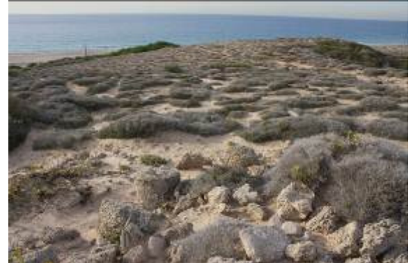
רצפת צדפים שנחשפה כנראה בעקבות הגשמים.