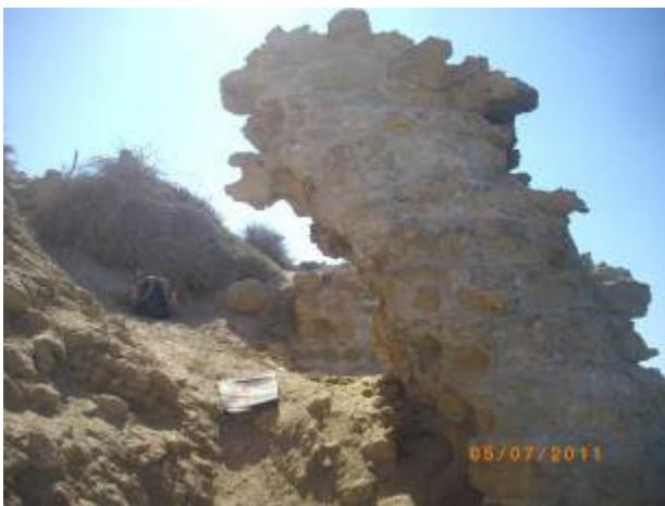
והנה עוד זווית.

שרידים של חומה פאטימית הניצבים על שפת הים בחוף פלמחים, בצד הצפוני של יבנה ים. השרידים בלויים מאוד, וצורת הבלייה יצרה בעיית יציבות: בפן הים עיקר הבלייה היא בראש החומה, ואילו בפן הרחוק מהים עיקר הבלייה היא לרגלי החומה.