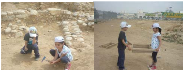
* צילום: אורית אפללו, רשות העתיקות.

בפרויקט שותפים גם קבוצת הסטודנטים המצטיינים של מכללת קיי - תוכנית רגב, בראשות ד"ר ורד יפלח. הסטודנטים ביקרו במקום, נפגשו עם גורמים בעירייה, ופועלים למען האתר ולמען חיבור הקהילה למורשת התרבותית שלו.