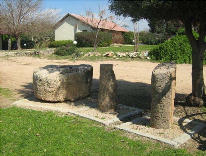
אוצרות: ד"ר אורית שמיר, רשות העתיקות.

התצוגה מוקמת בחצר המועדון (בית יהושע) ופתוחה לכל. בתצוגה חוליית בור (פי הבור), אבני מיל, סורג מכנסיה (שבר עמוד), אגן ריסוק של בית בד להפקת שמן הזית.