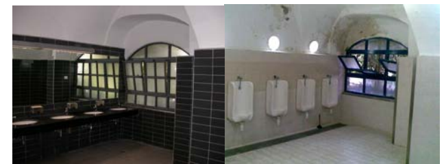
* לפני ואחרי.

צוותי השימור של מינהל השימור עדיין עובדים בימים אלו על חלקים שונים במתחם. העבודות צפויות להסתיים בתחילת שנת 2013, ולאחריהן, יש לדאוג כי האתר ינוהל ויתחזק היטב כדי שהשקעה מרובה זו לא תרד לטמיון.