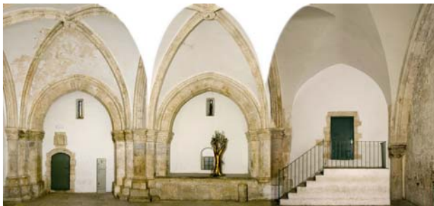
* חדר הסעודה האחרונה.

צוותי השימור של מינהל השימור עדיין עובדים בימים אלו על חלקים שונים במתחם. העבודות צפויות להסתיים בתחילת שנת 2013, ולאחריהן, יש לדאוג כי האתר ינוהל ויתחזק היטב כדי שהשקעה מרובה זו לא תרד לטמיון.