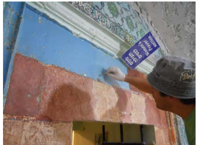
* חסיפת משקוף אבן מעוטר מתחת לשכבות של צבע.

תכנון השימור במתחמי האתר נערך בתיאום עם פרויקט שיקום המכלולים הציבוריים של מתחם קבר דוד. במסגרת הפרויקט, המתחם מטופל, לראשונה מאז קום המדינה, מתוך ראייה תכנונית כוללת ואחידה. עבודות השימור החלו בשנת 2010, והן הבסיס לעבודות השיקום והפיתוח במקום. נערכו פעולות לייצוב קירות וקמרונות, הוסרו סכנות קיימות ונחשפו ערכיו ההיסטוריים והאדריכליים המגוונים של המבנה, שהוסתרו מאחורי תוספות בנייה מודרניות שנוספו לאתר ברבות השנים.