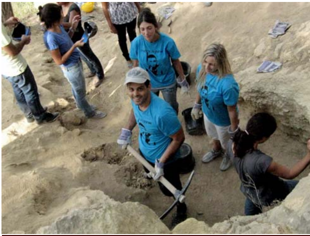
לפרטים נוספים על הפרויקט

לאחרונה שיקמו תלמידי בתי ספר מירושלים יחד עם סטודנטים לראיית חשבון את האתר במסגרת פרויקט תרומה לקהילה שיזמו, בסיוע רשות העתיקות.