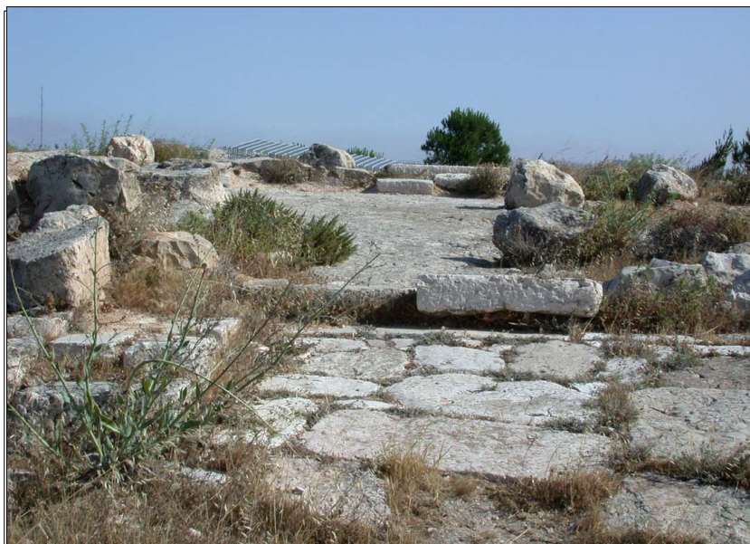
שרידי הקפלה, מבט מדרום.

שרידי מבנים בפסגת גבעה. ביניהם: שרידי קפלה ביזאנטית, בעלת אפסיס יחיד, ומתחת להם מערה גדולה שלה פתח וגרם מדרגות חצוב. במערה נשמרו, אולי, שרידים מקודשים, עליהם ניתן היה לצפות מתוך פתח ברצפת הקפלה. בשטח האתר נחשפו מספר מתקנים כגון: תנור, כבשן סיד, בור מים וגת בה יצרו יין מהגפנים שגדלו, כפי הנראה, במדרון הטראסות הצפוני. באתר נמצא אוצר של 200 מטבעות, רובם ככולם מהתקופות האומאית והעבאסית. ממערב לשרידים אותרה גת, חלקה חצוב בסלע וחלקה בנוי אבן. בקרבת מקום – בור מים חצוב בסלע ובורות איסוף מסביבו.