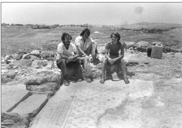
האתר בזמן החפירה, מתוך ארכיון הצילומים של רשות העתיקות