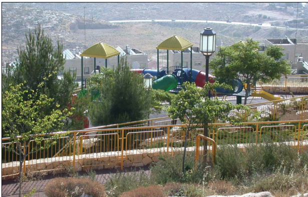
גינה שכונתית בסמוך לאתר