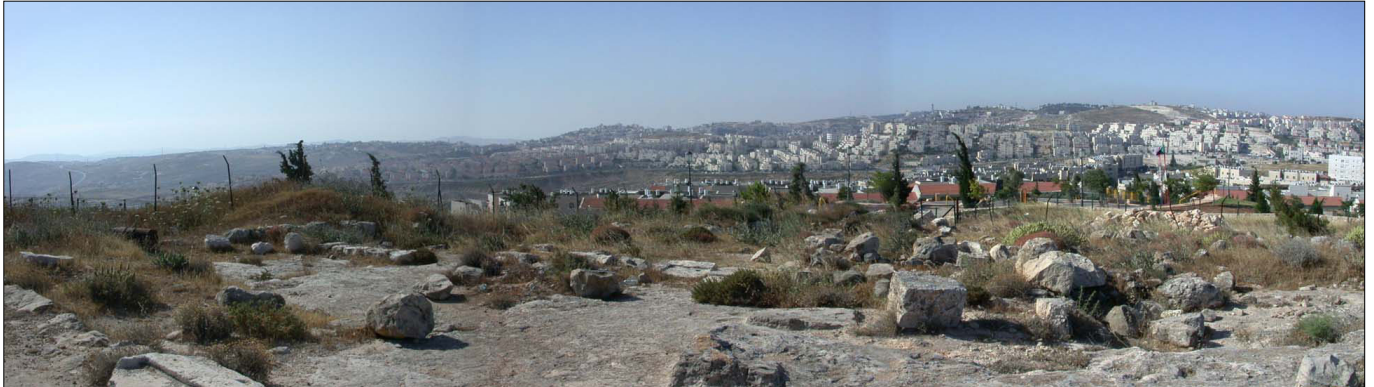
מראה כללי, מבט מכיוון צפון.