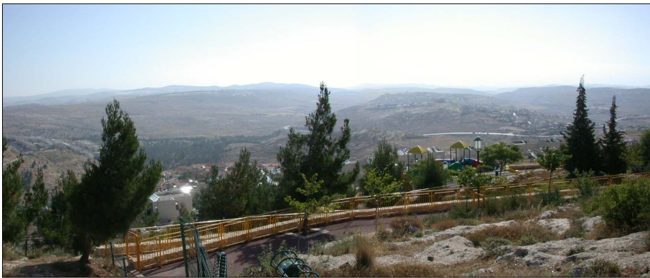
מבט מהאתר לכיוון דרום-מזרח