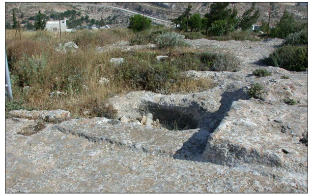
סימני חציבת קירות בסלע.